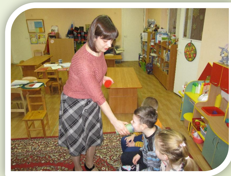
Банка для криков