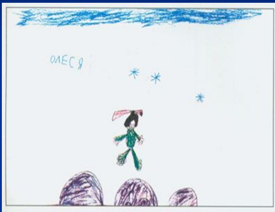
Рисунок на тему «После снегопада»