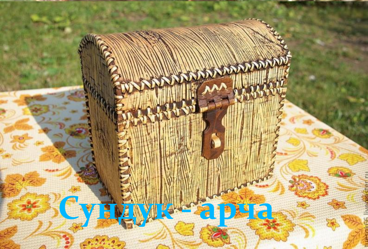
Сундук - арча