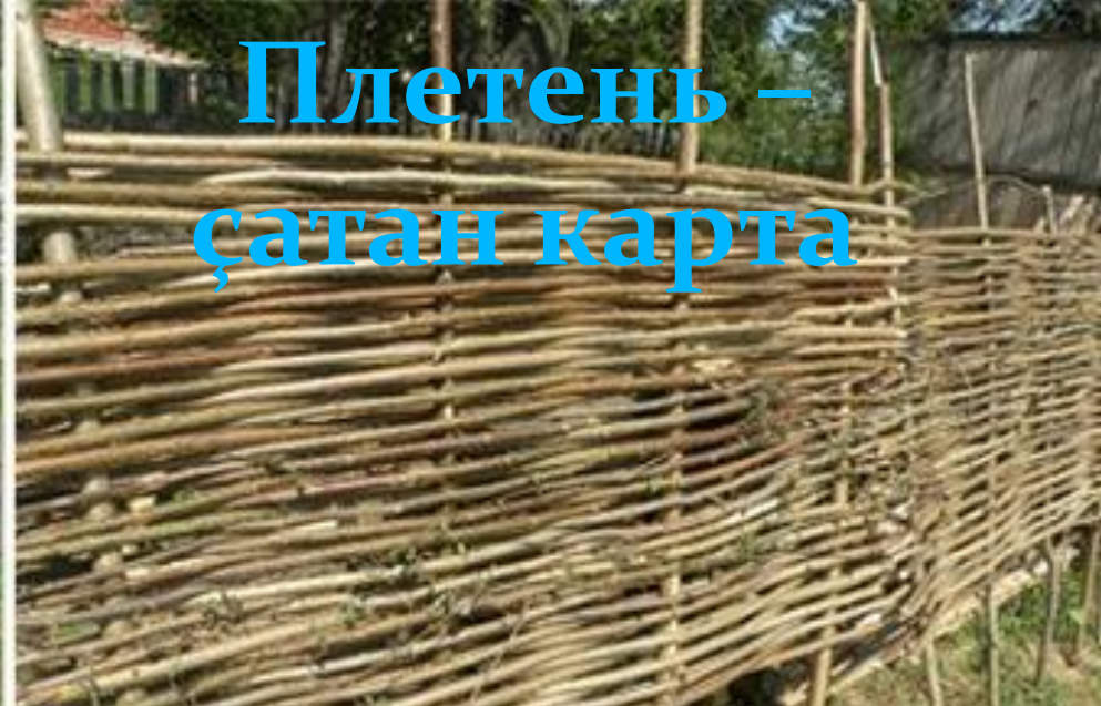
Плетень – җатан карта