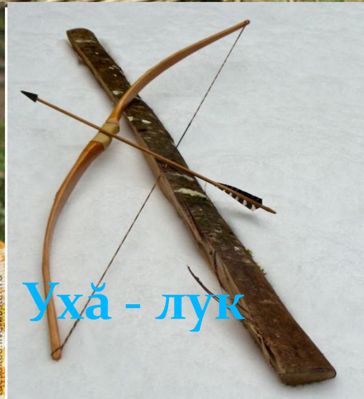
Ухә - лук