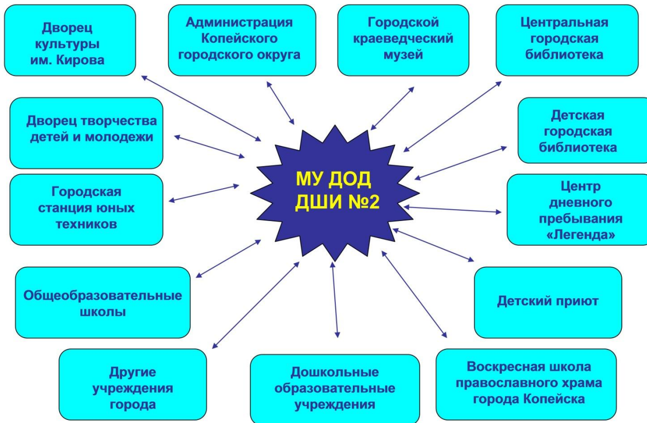
Схема взаимодействия МУ ДОД ДШИН №2 с другими учреждениями города.