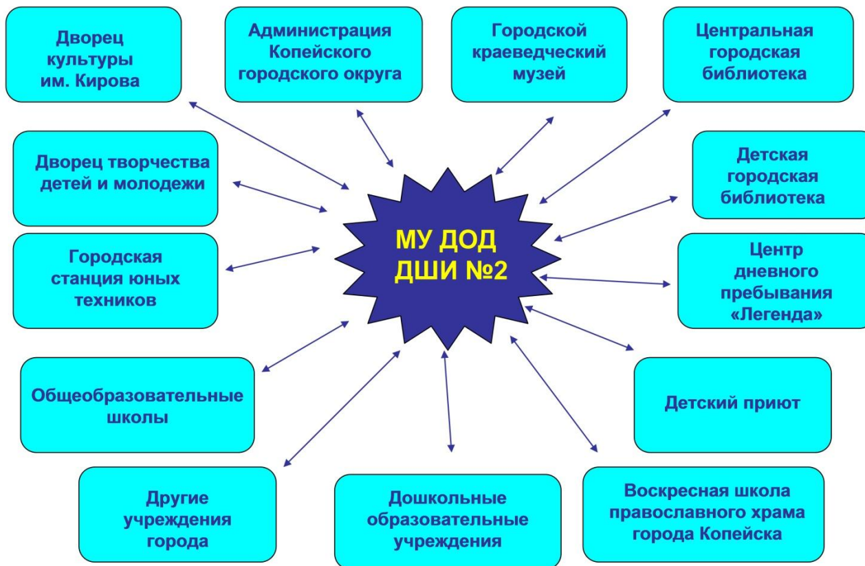
Схема взаимодействия МУ ДОД ДШИН №2 с другими учреждениями города.