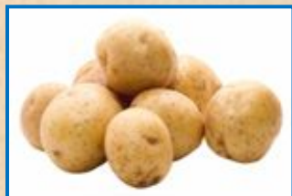
КА РТОФЕ ЛЬ