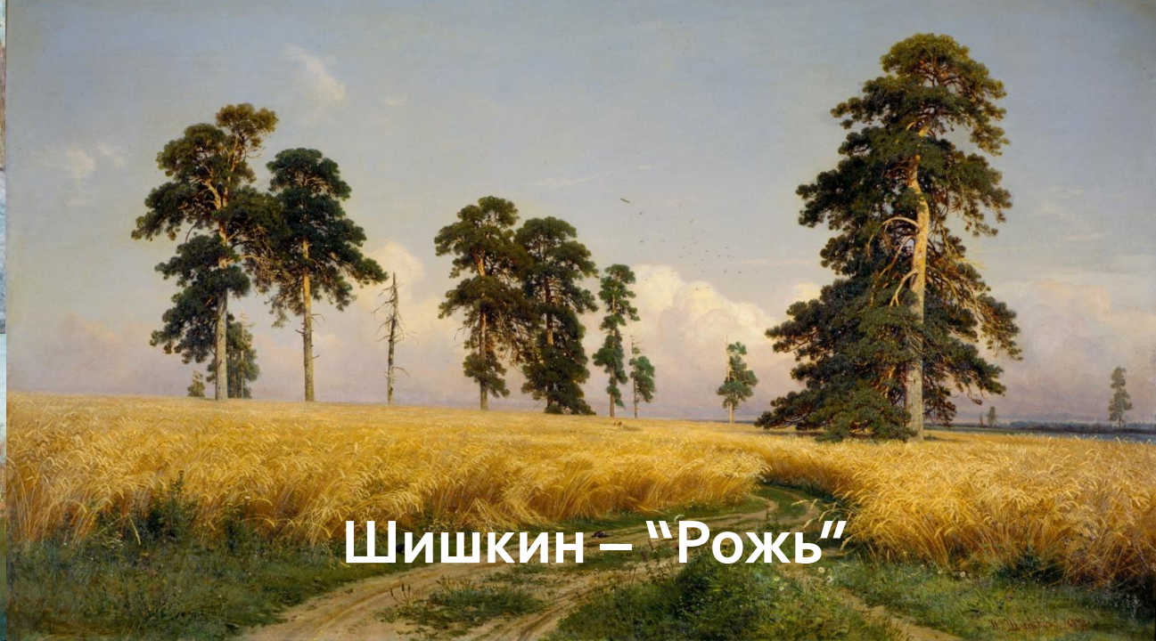
Шишкин – "Рожь"