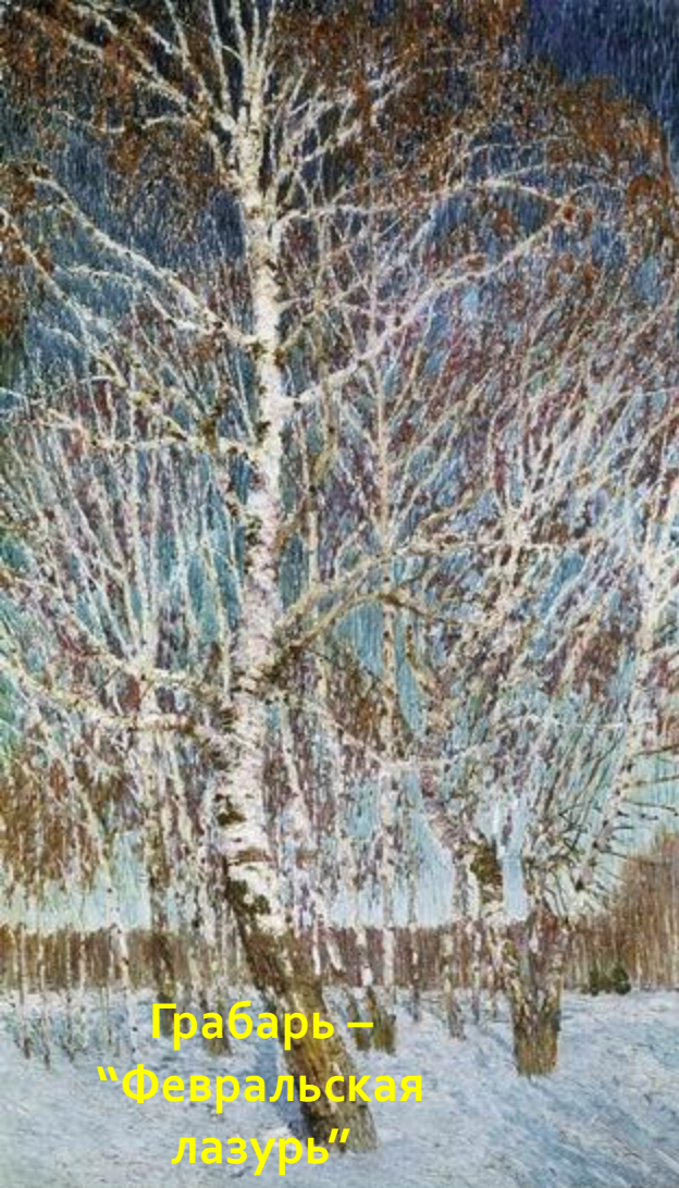
Грабарь – "Февральская лазурь"