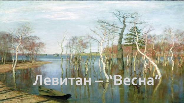
Левитан – "Весна"