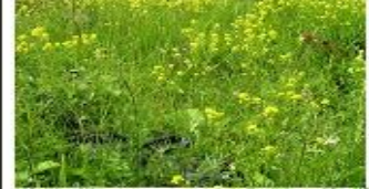
5. Пойменные почвы