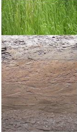
1. Дерново-подзолистые почвы