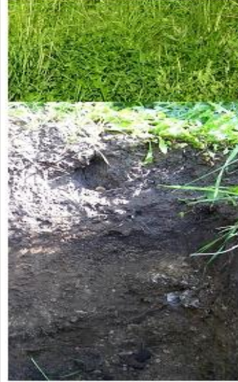
2. Дерново-карбонатные почвы