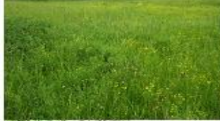
4. Серые лесные почвы