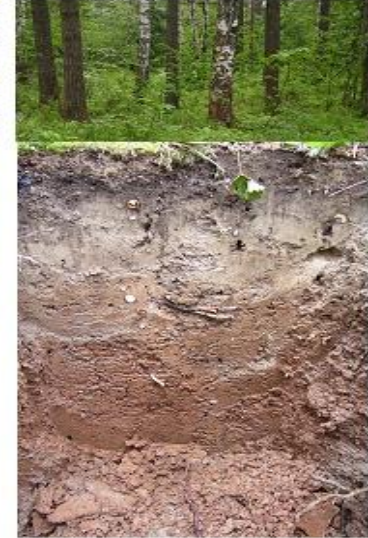
3. Подзолистые почвы