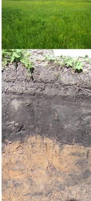
4. Серые лесные почвы