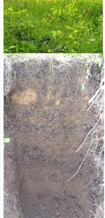
5. Пойменные почвы