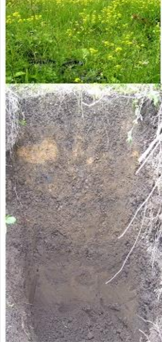
5. Пойменные почвы