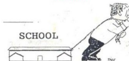
Учитель глазами семьи