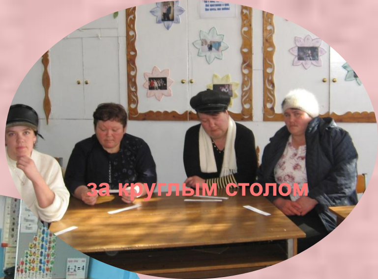
за круглым столом