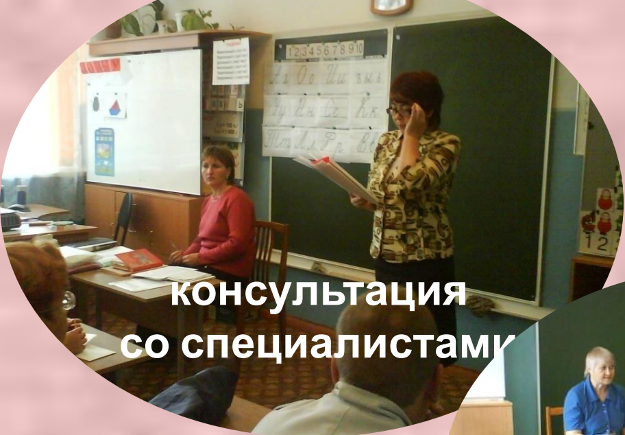
консультация со специалистами