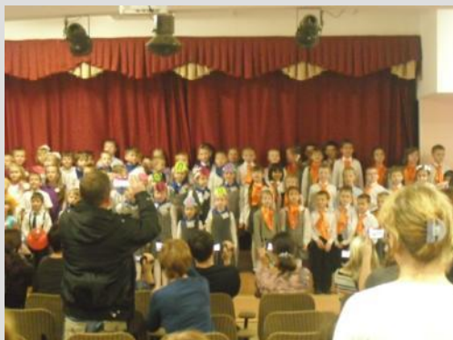
Праздники для 1-х классов