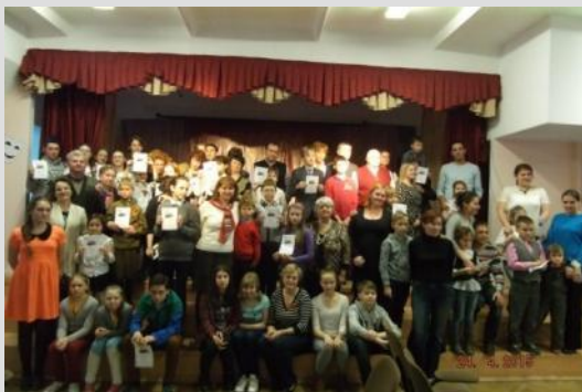
Праздник песни «В кругу семьи»