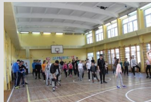
Спортивный семейный праздник «Когда мы вместе»