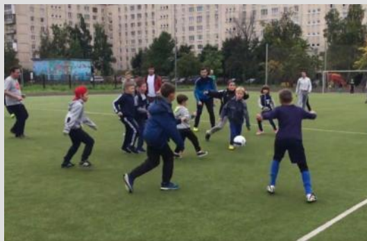
Соревнования «Папа, я – спортивная семья»