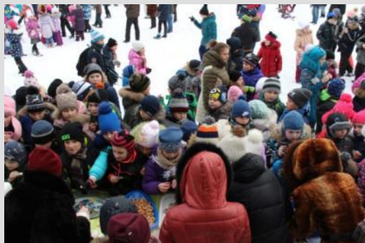
Праздник Широкой масленицы