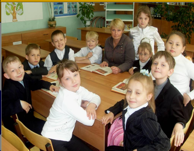
Фото – галерея.