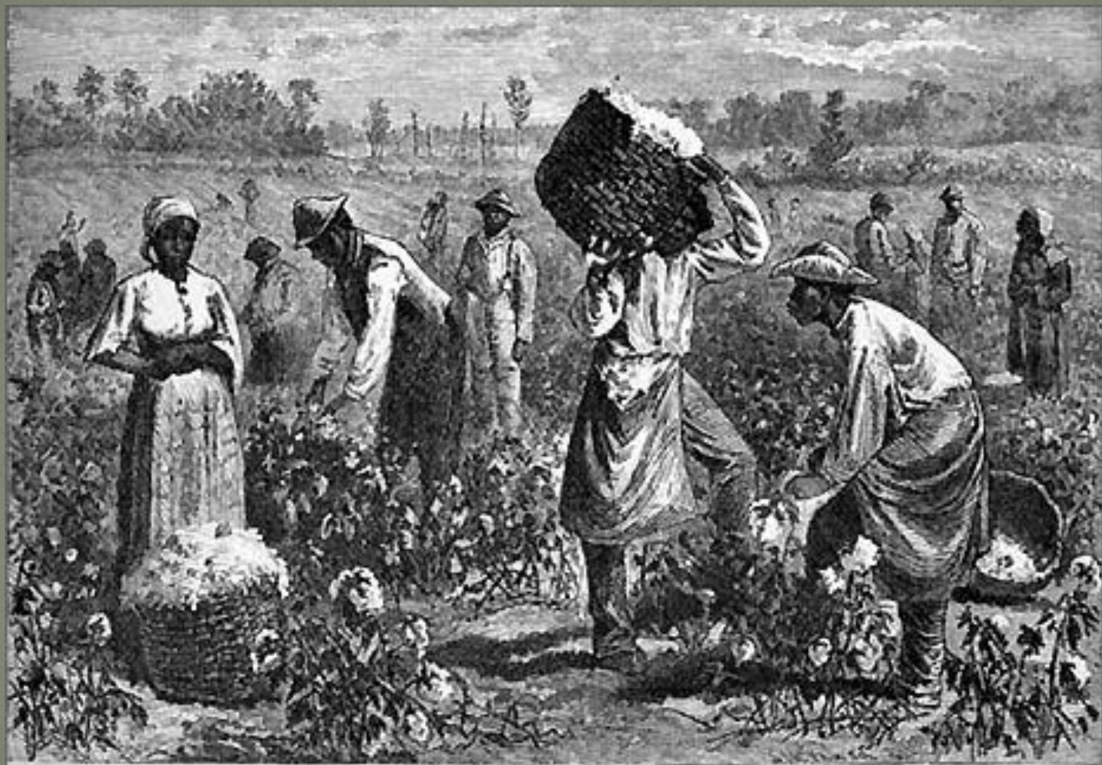
Scene on a Cotton Plantation.