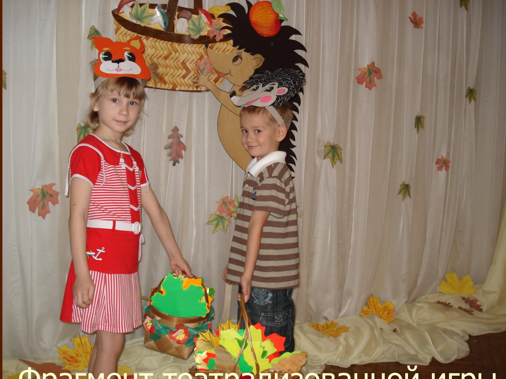
Фрагмент театрализованной игры «Весёлые зверята»