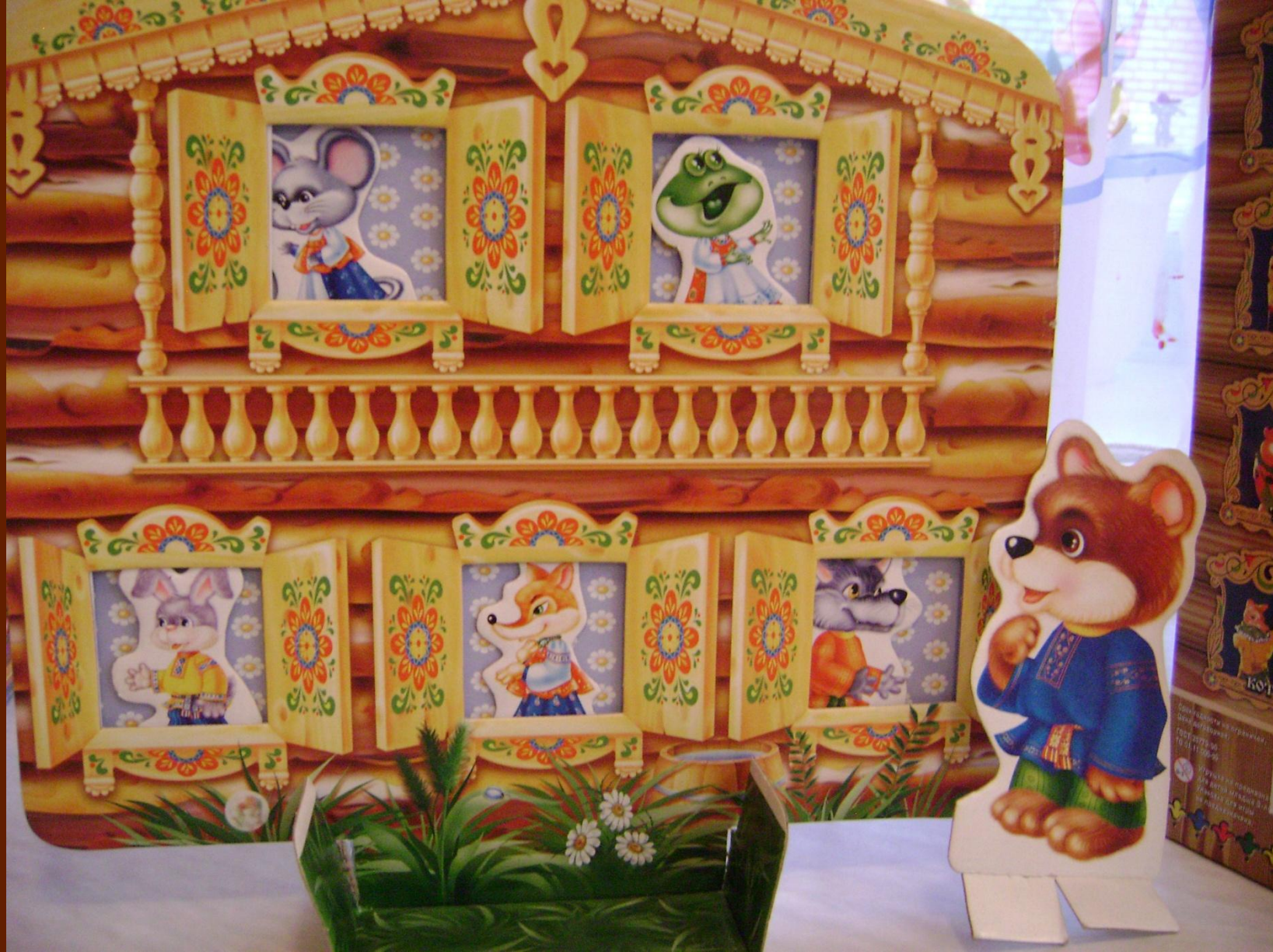
Фрагмент театрального уголка в первой младшей группе. Плоскостной театр.