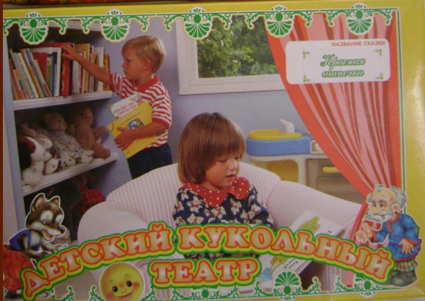
Настольный кукольный театр с ширмой.