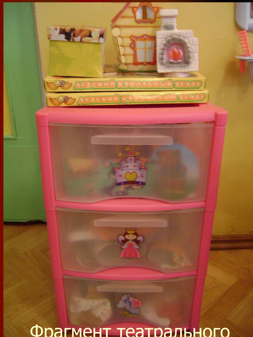
Фрагмент театрального уголка во 2 младшей группе.