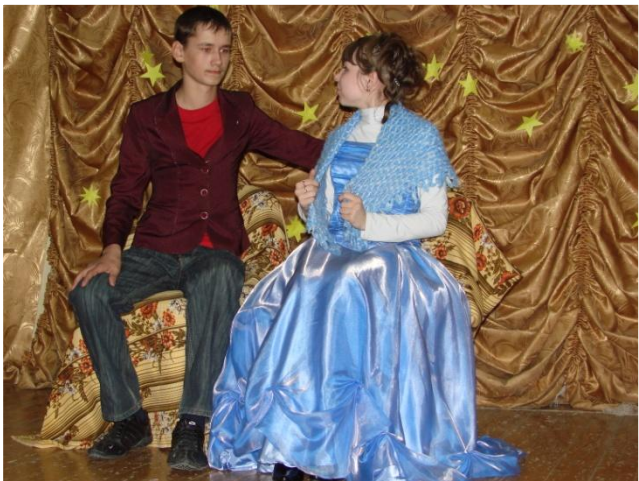
Публикация в газете «Пламя»