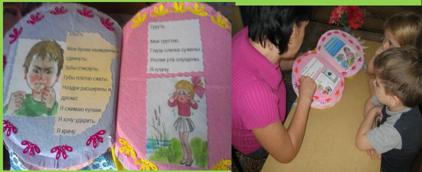
Воспитатель рассказывает, что такое эмоции