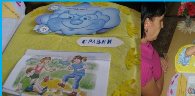
На следующих страницах пособия дошкольники