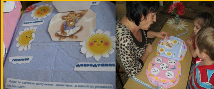
Дети сопоставляют настроение животных и ромашек