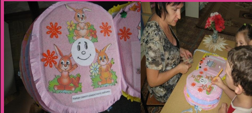
Игра «Найди радостного зайца»