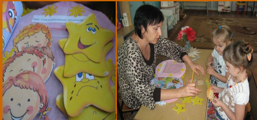
1. Игра «Звезда настроения»