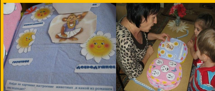
Дети сопоставляют настроение животных и ромашек