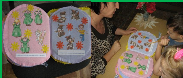
Подбор по эмоциям щенка и хозяина.