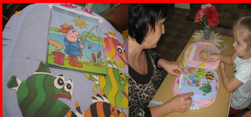
Сравниваем настроение рыбок и рыбаков