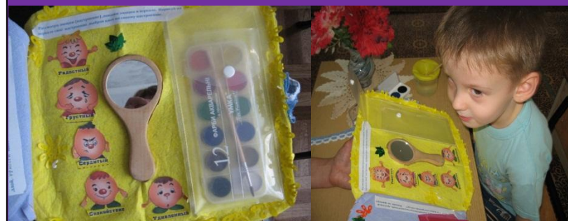
Игра «Покажи эмоции в зеркале»