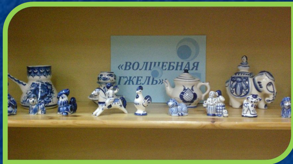
Коллекция «Вокруг света» и «Волшебная гжель»