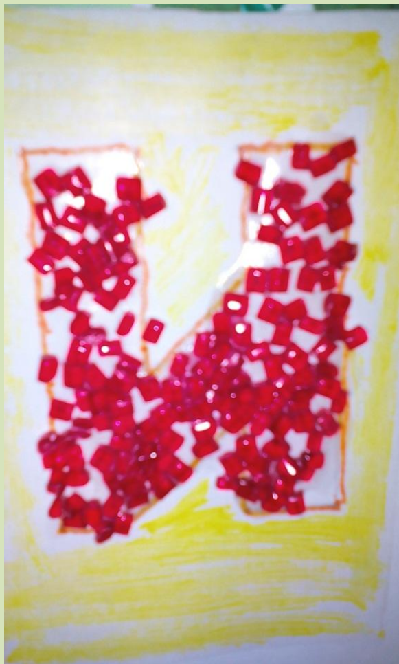
Буква И из бисера...