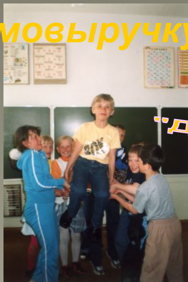
Традиционный "День именинника"