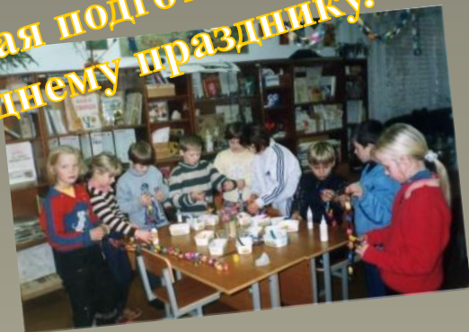
Дружная подготовка к Новому году.