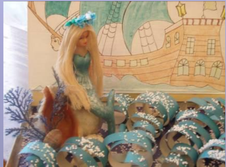
Экспонат “Музея сказок”