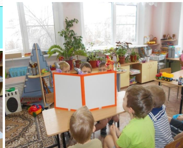
Показываем кукольный спектакль