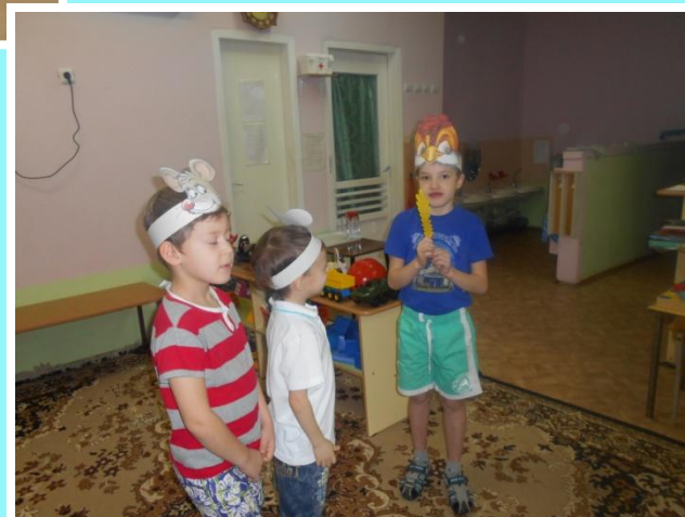
Драматизация сказки «Колосок»