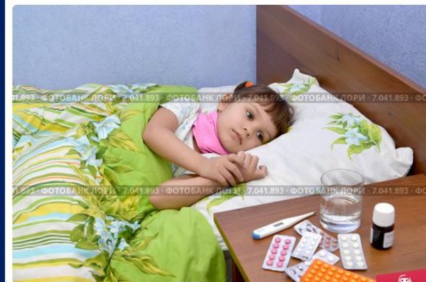
Маленькая грустная больная девочка лежит в постели. Больничная п...

• Иринка заболела. Мама уложила её в постель, дала горькие лекарства. На улице светило солнце. Иринка грустно подумала: все на реке, собирают камешки