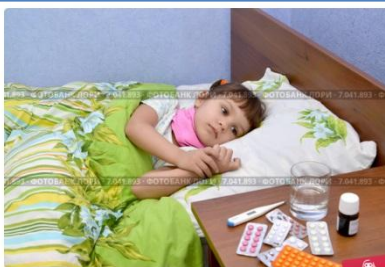
Маленькая грустная больная девочка лежит в постели. Больничная п...