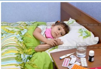
Маленькая грустная больная девочка лежит в постели. Больничная п... © Ирина Борученко / Фотобанк Лори l0r1407/7041893