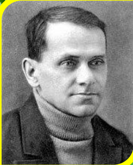
П.П. Блонский 1884-1941