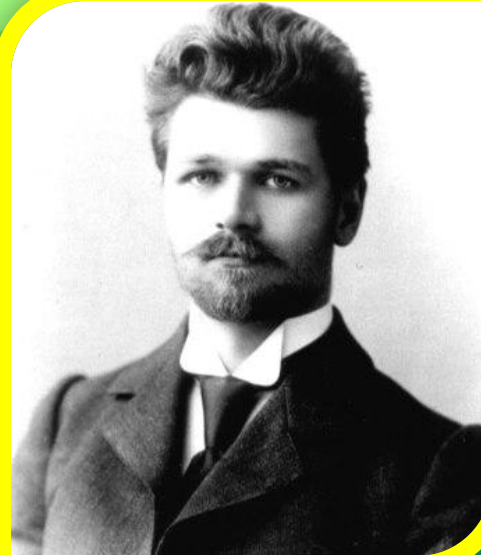
С.Т. Шацкий 1878—1934