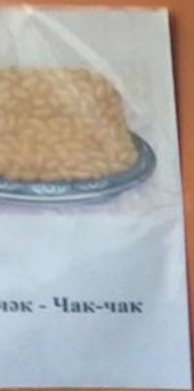
Чак - Чак-чак