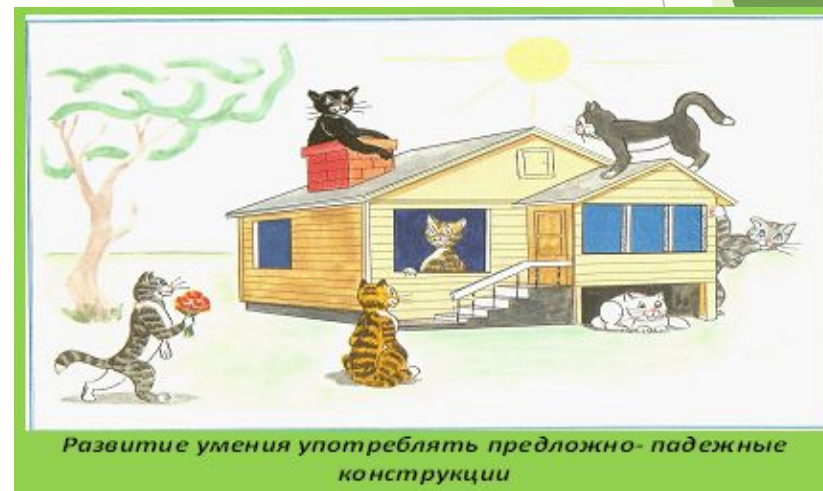
Развитие умения употреблять предложно-падежные конструкции