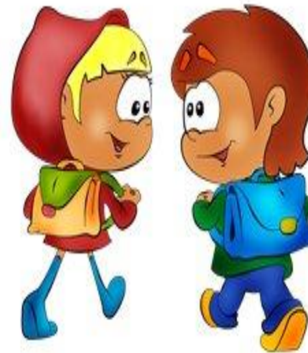
Дорога в школу