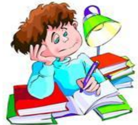
Подготовка к урокам