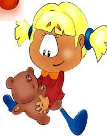
Игры перед сном