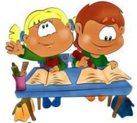
Занятия в школе