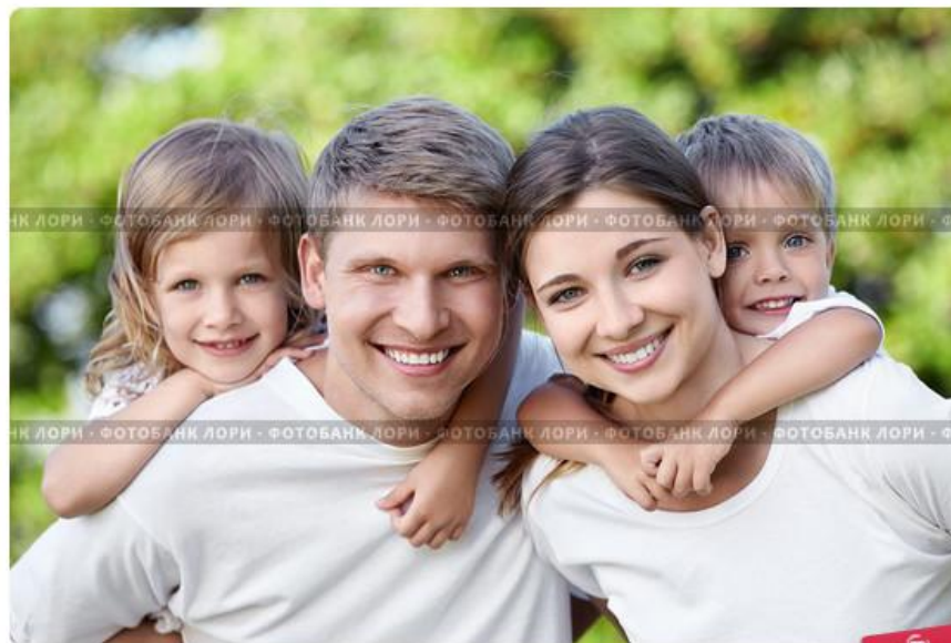
Счастливая семья в парке