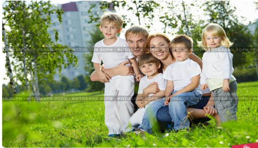
Большая семья