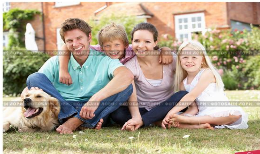
Счастливая семья с собакой, сидят на лужайке перед домом