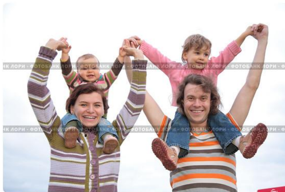
Счастливая семья с двумя детьми на фоне неба