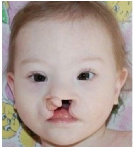
Ринолалия (Расщелина губы и нёба)