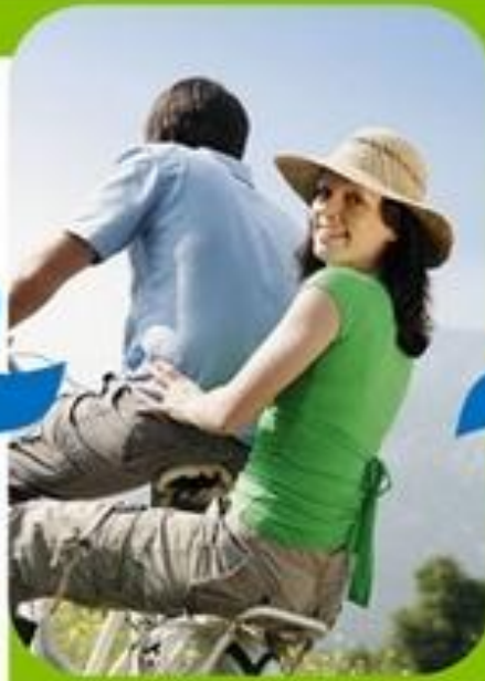
Активный образ жизни