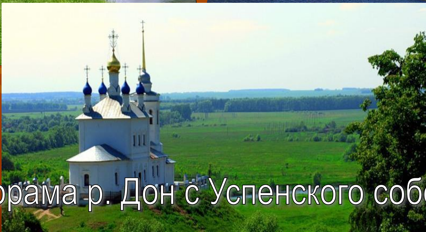
Панорама р. Дон с Успенского собора