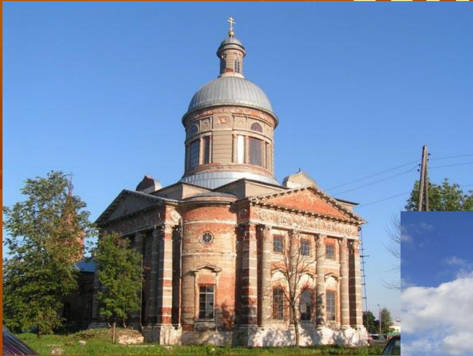
Никольский собор (1810-1850 гг.)