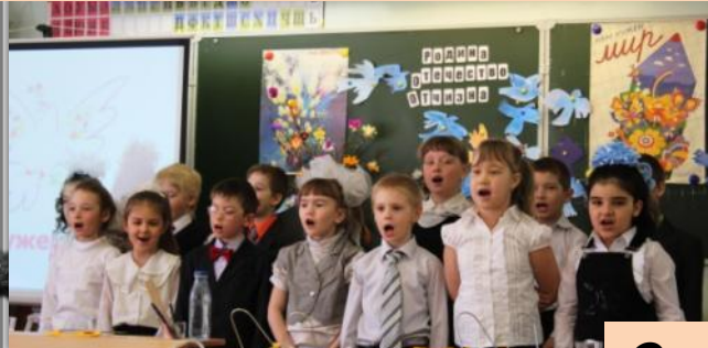
Классный час «Нам нужен мир!»