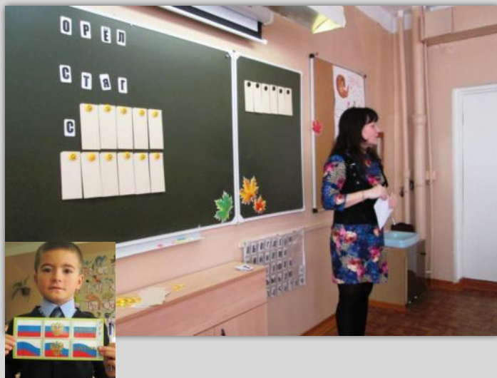
«Поле Чудес» «Символы государства»