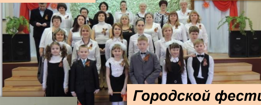
Городской фестиваль хоров