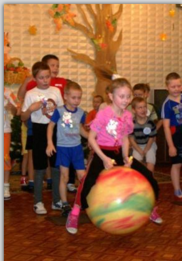
Спортивная игра «Зарница»