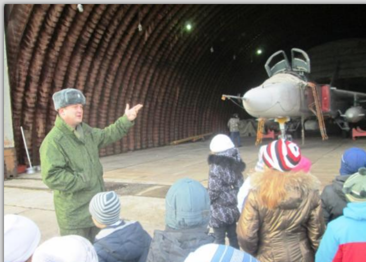
Экскурсия в воинскую часть