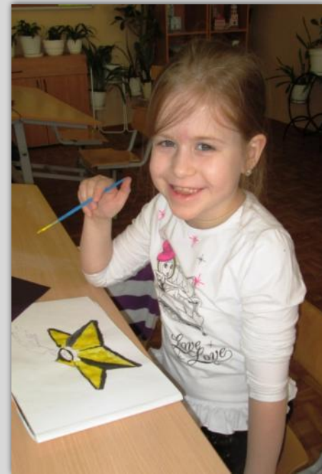
Акция «Красная звезда»