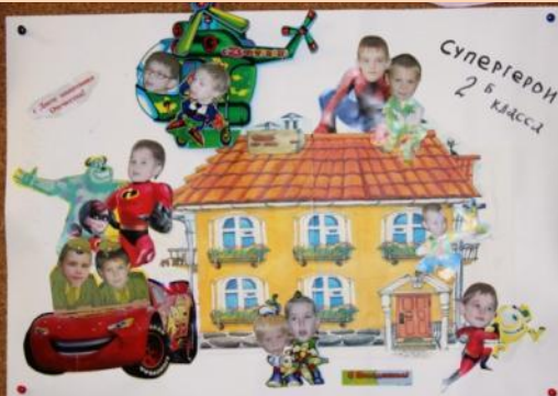
Стенгазета ко дню защитников Отечества