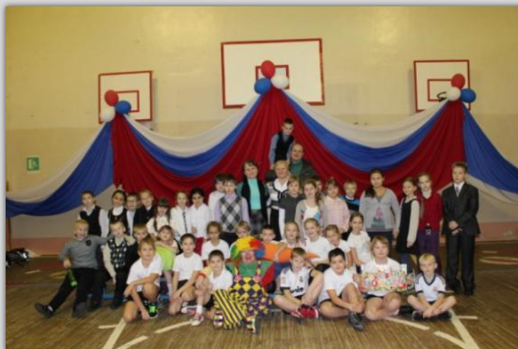
Соревнования «Быстрее, выше, сильнее!»