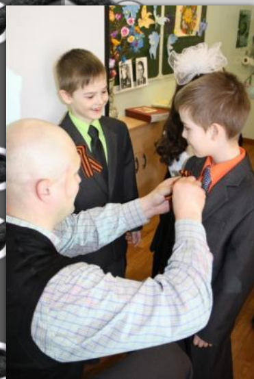
Акция «Гвардейская ленточка»