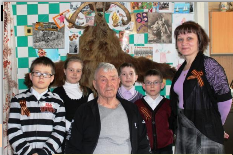
Встречи с ветеранами