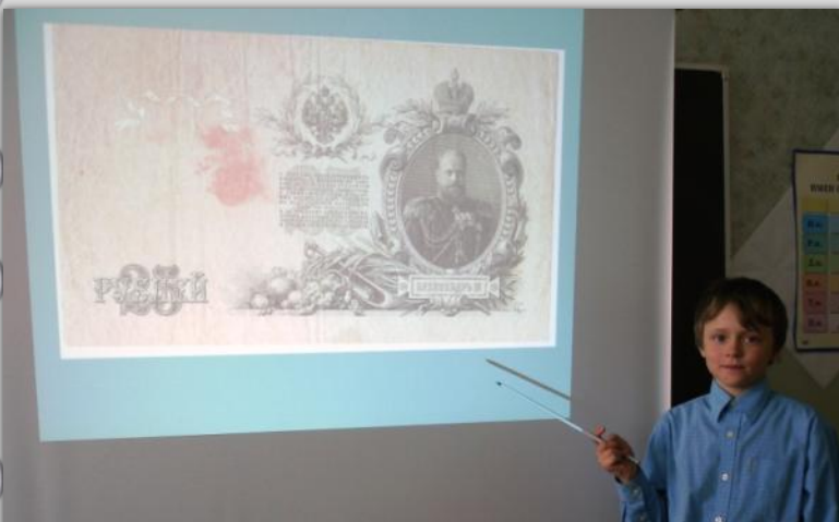
«Россия в денежных знаках»