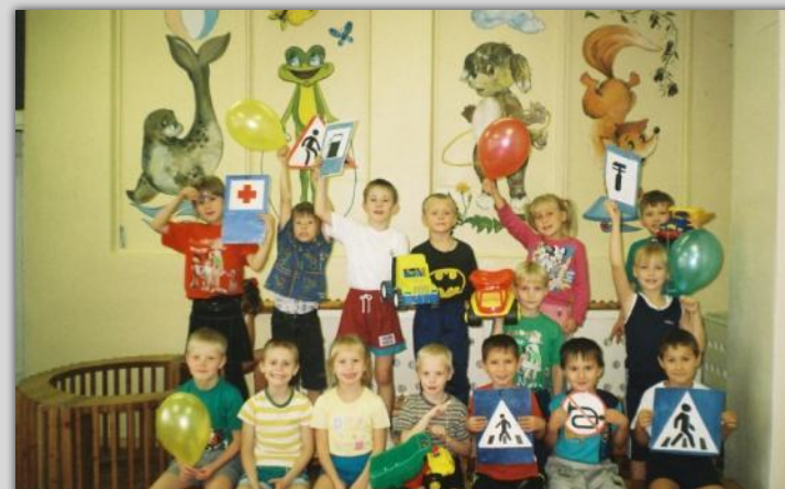
Спортивная игра по правилам дорожного движения