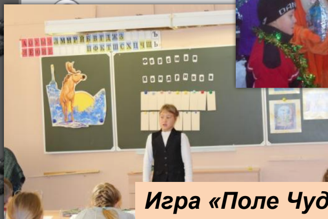
Игра «Поле Чудес» «Улицы города»