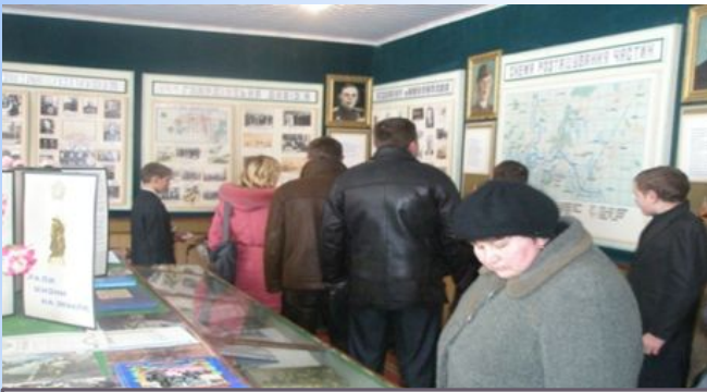
У музеї бойової слави ЗОШ І-ІІ ст. с. Мокрець