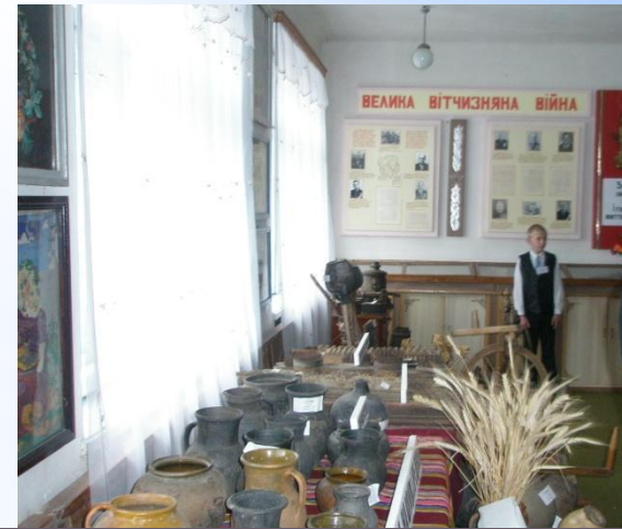
Музей історії села Новосілки