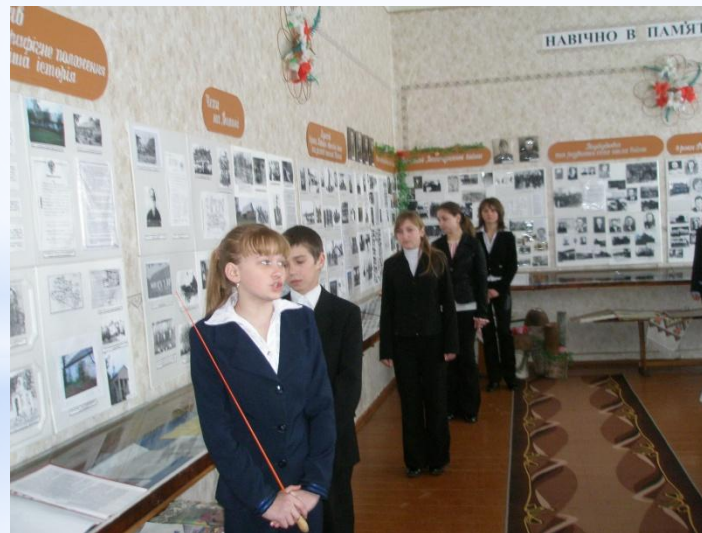
Музей історії села Купичів