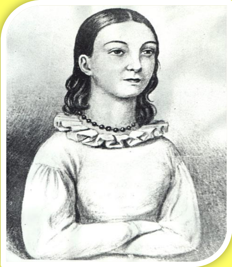
Н.А.Дуровой 14 лет