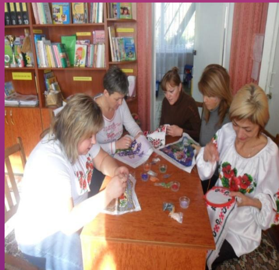
Майстер –клас «Вишивка картин бісером»