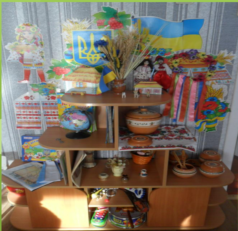
Група №10 «Всезнайки»