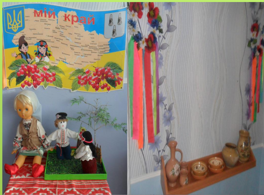
Група №5 «Барвінок»