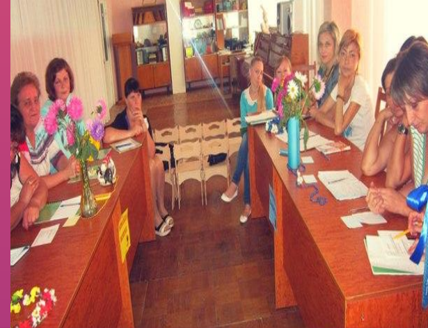
Ділова гра «Я люблю Україну!»