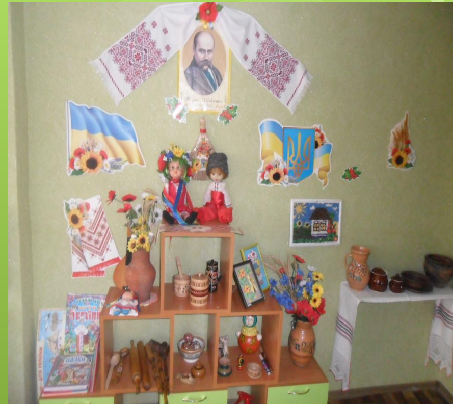
Група №3 «Росток»