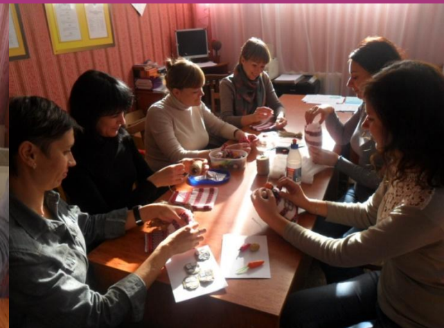
Майстер-клас «Виготовлення оберегу»