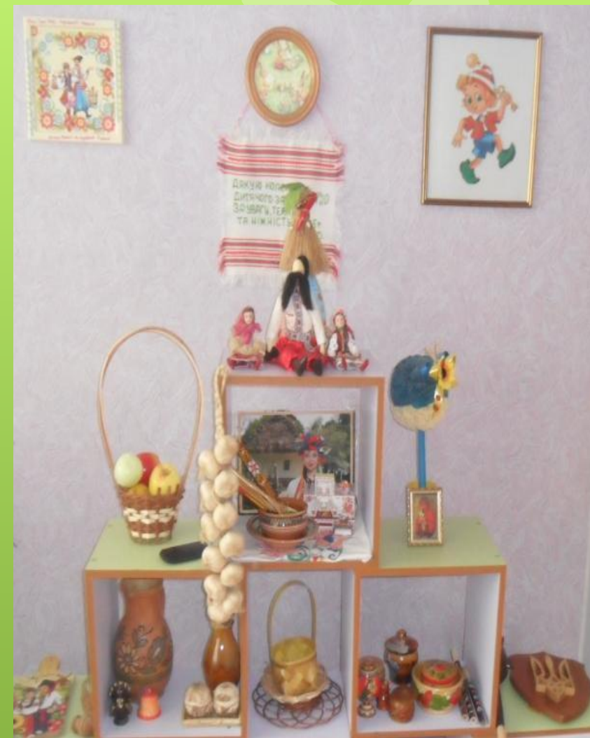
Група №6 «Буратіно»