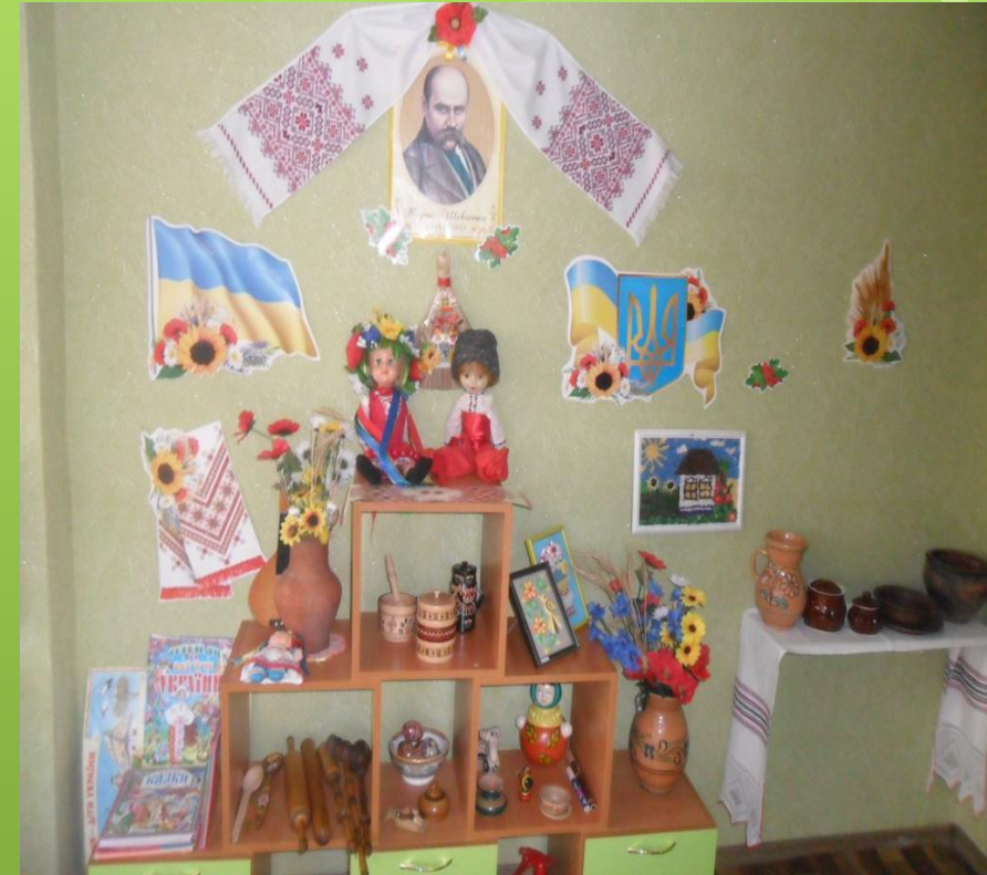
Група №3 «Росток»