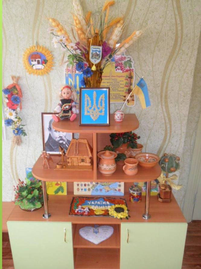
Група №8 «Зірочка»