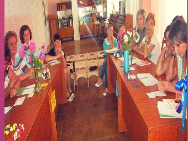
Ділова гра «Я люблю Україну!»