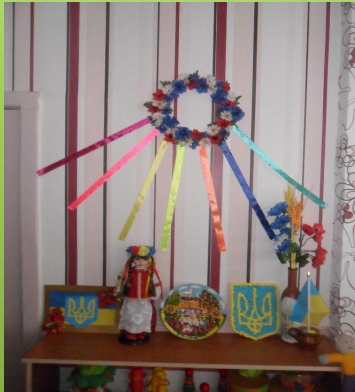
Група №2 «Сонечко»