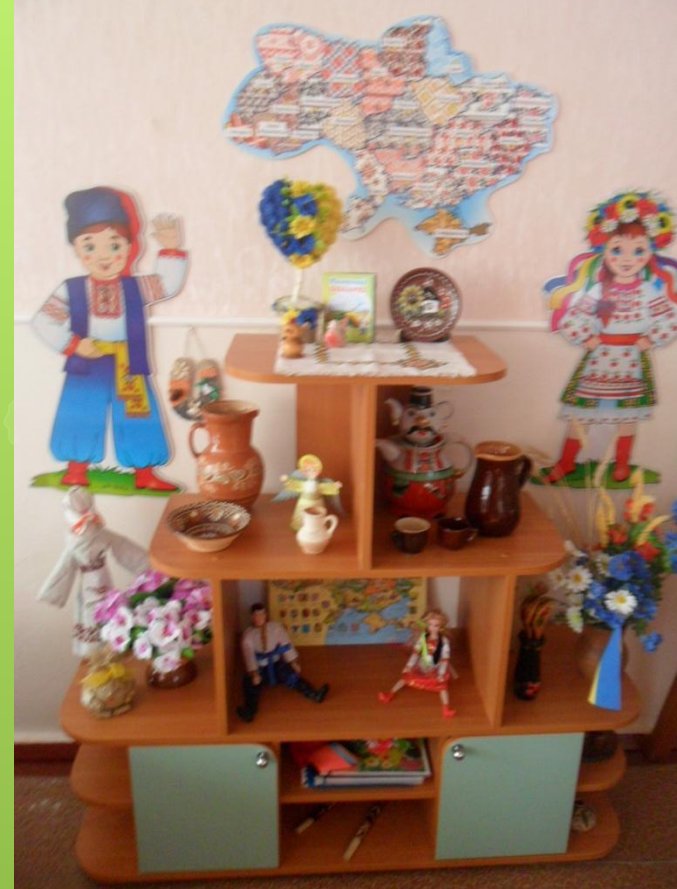
Група №9 «Розумники»