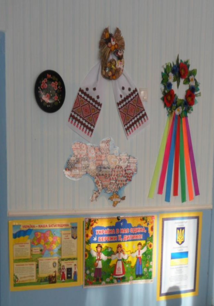
Група №4 «Джерельце»