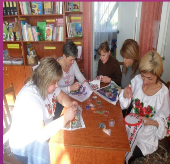
Майстер –клас «Вишивка картин бісером»