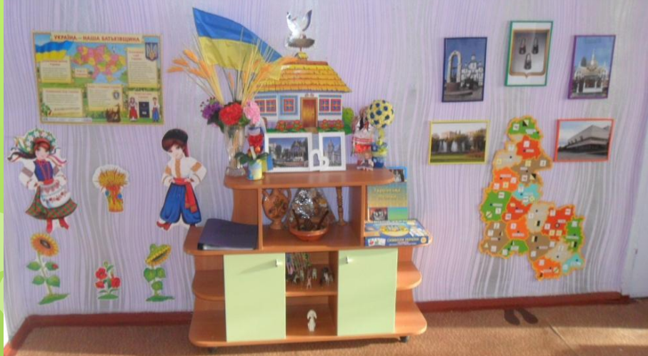
Група №7 «Дзвіночок»