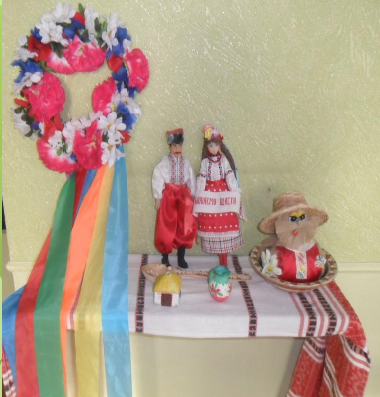
Група №1 «Перлінка»