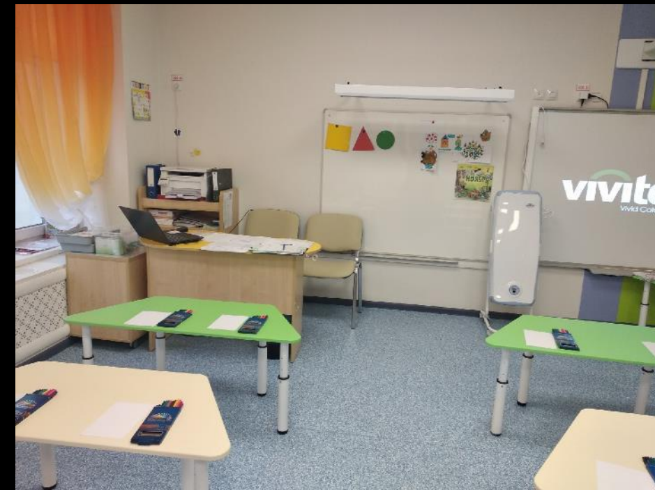
1.6. Рабочий сектор (методическая литература педагога)