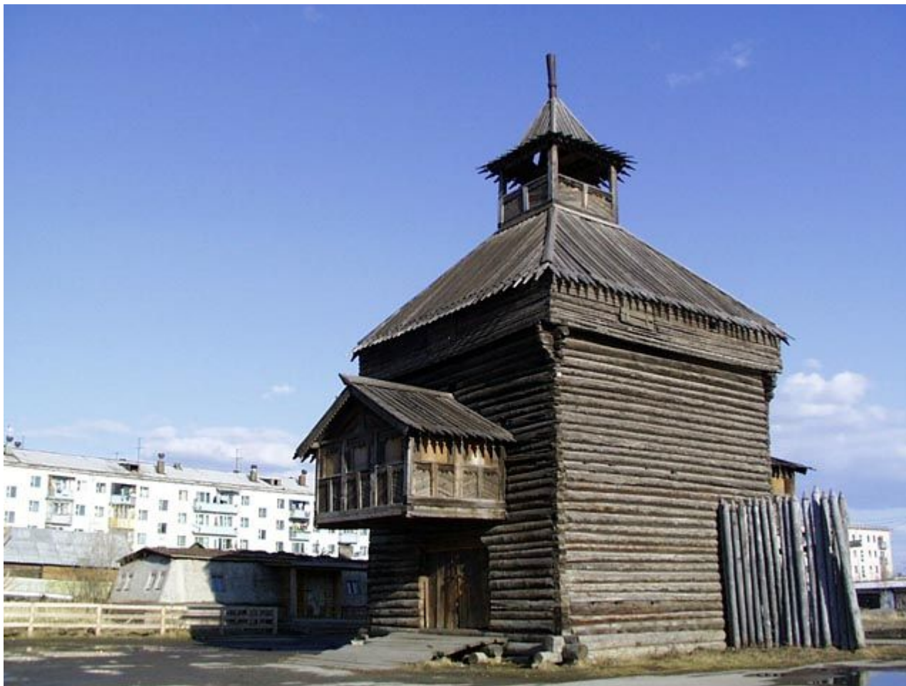
Надвратная башня Якутского острога