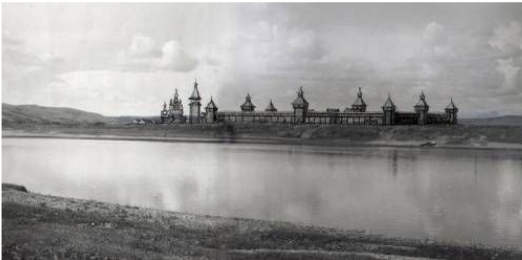
Панорама Нерчинского острога.