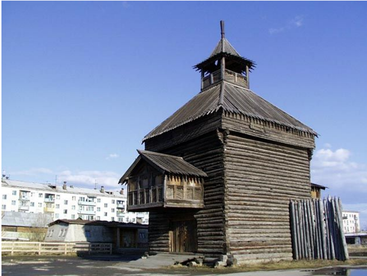
Надвратная башня Якутского острога