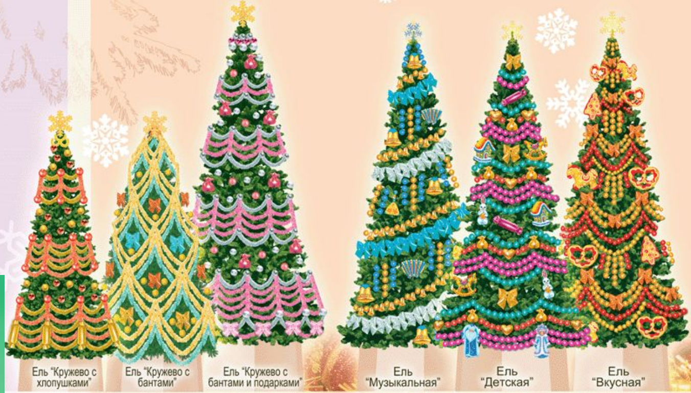
Ель "Кружево с хлопучками"