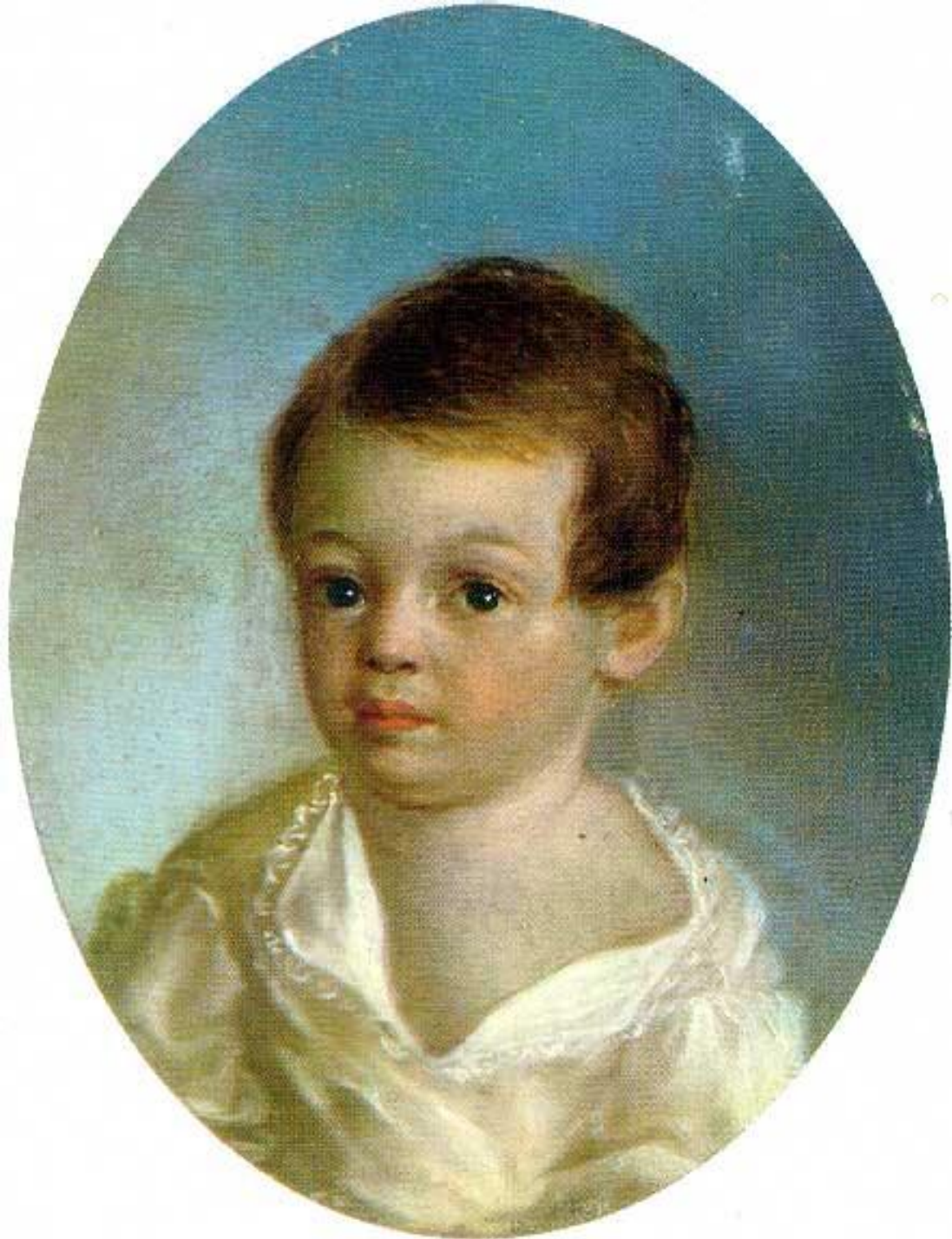
Саша Пушкин в раннем детстве