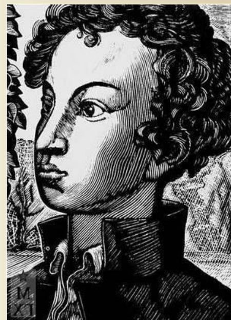
Комната №14 Александра Пушкина