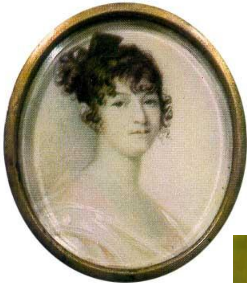
Мать А.С.Пушкина, Надежда Осиповна Пушкина, приходилась внучкой А.П.Ганнибалу