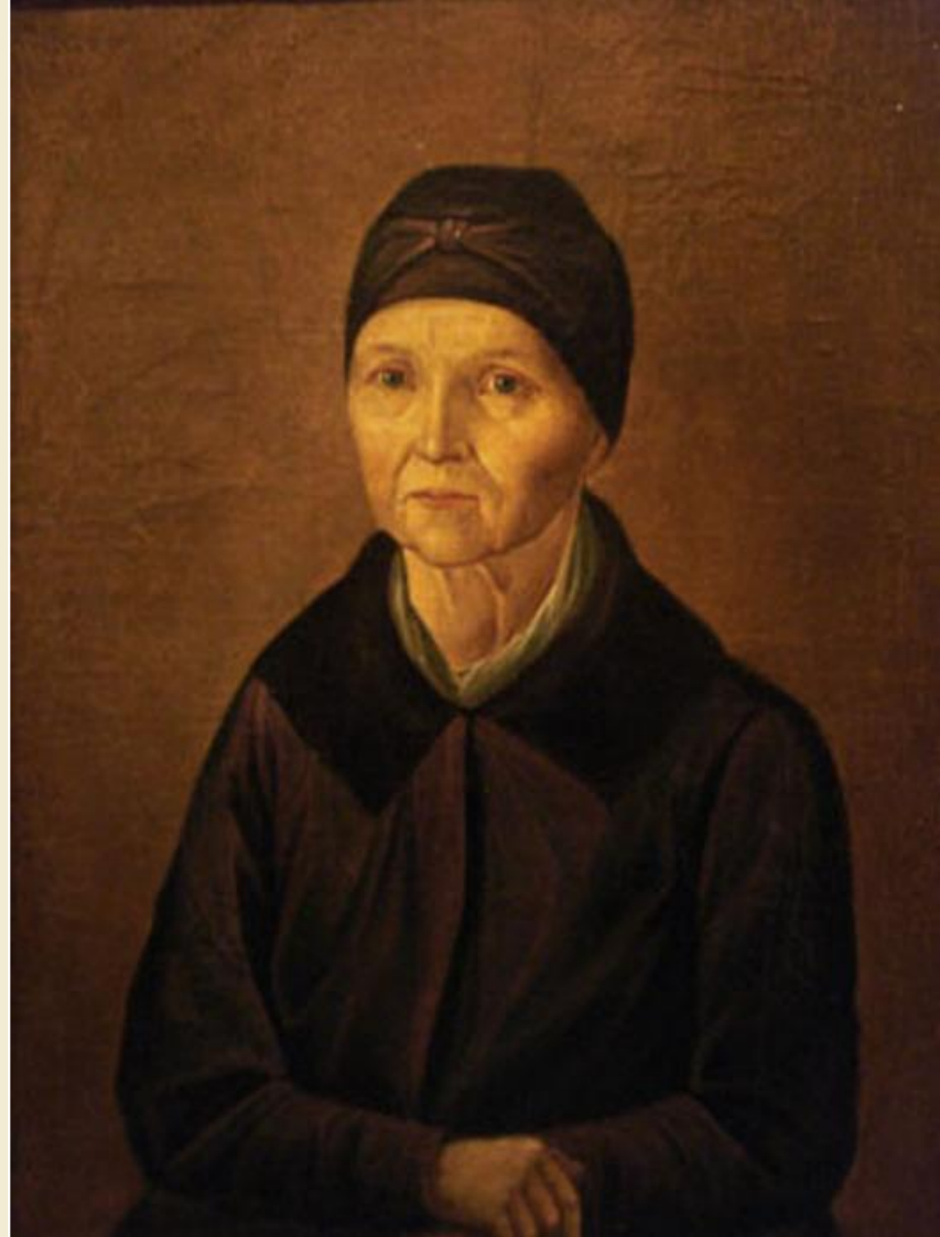
Няня А.С.Пушкина – Арина Родионовна