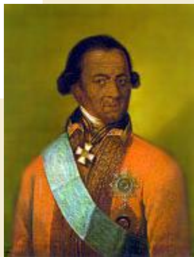
Прадед А.С.Пушкина, А.П.Ганнибал - арап Петра I, впоследствии русский генерал