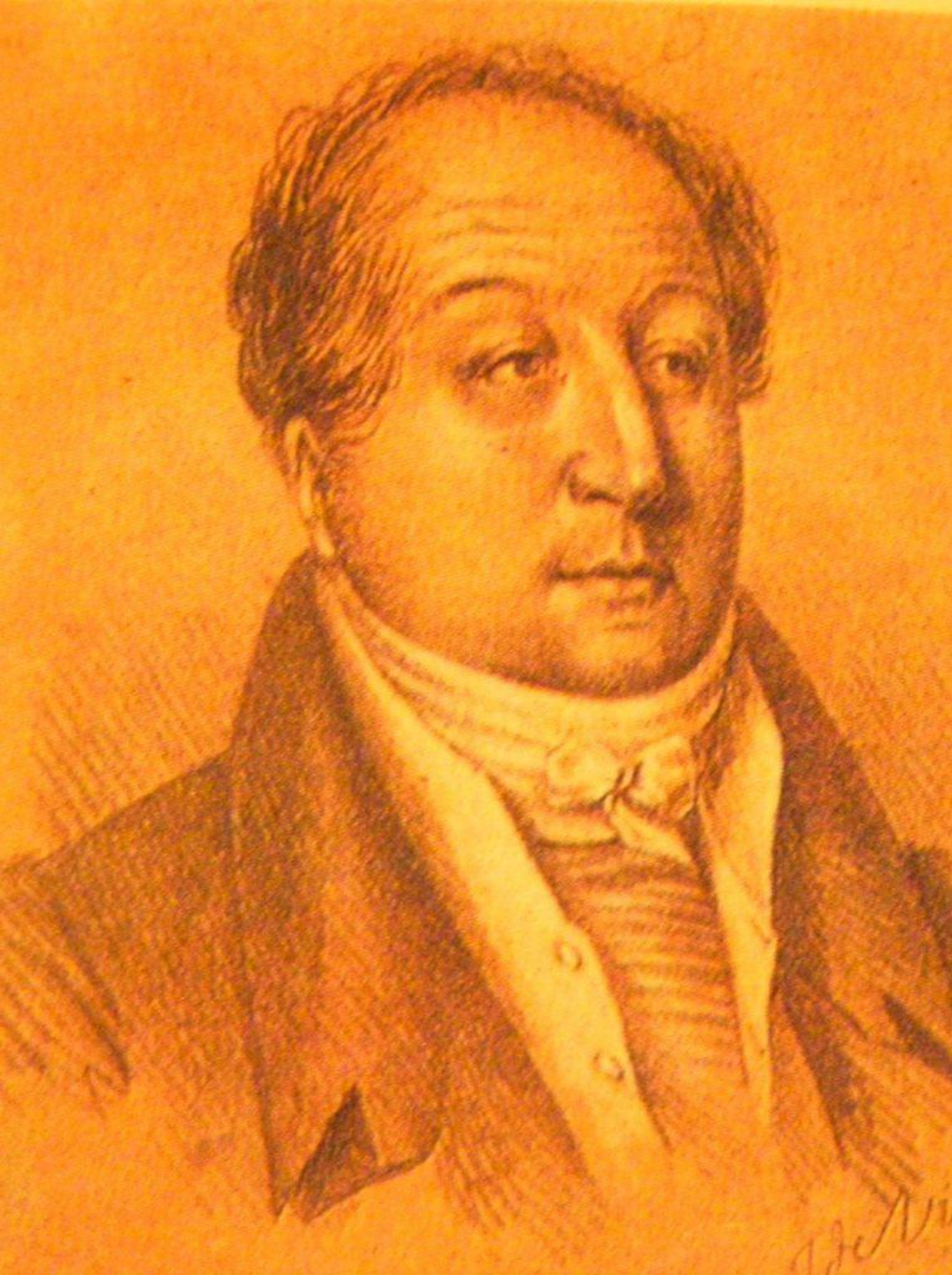
Дядя А.С.Пушкина – Василий Львович Пушкин