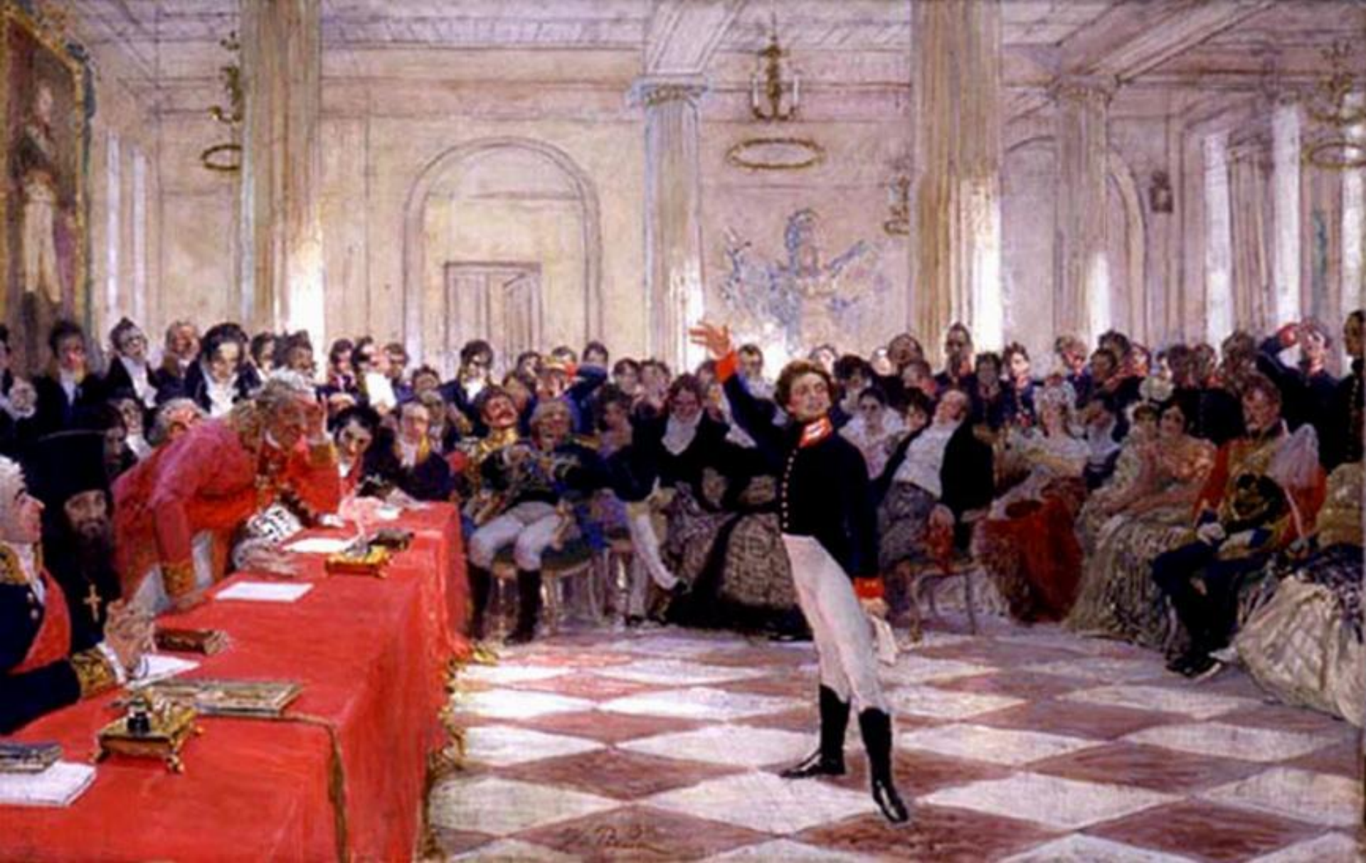
Экзамен. Чтение стихотворения «Воспоминания в Царском селе»