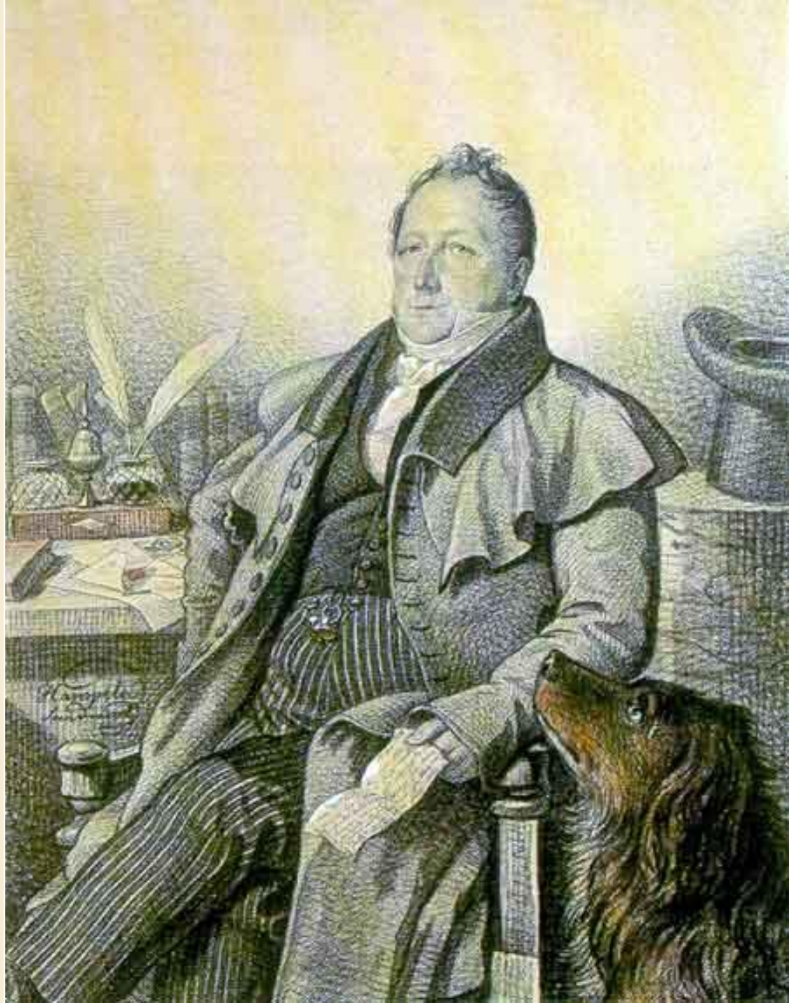
Сергей Львович Пушкин – отец А.С.Пушкина