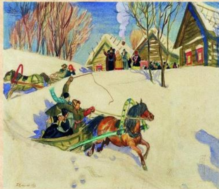
Четверг - РАЗГУЛ

Четверг «Разгуляй». В четверг люди устраивали традиционное катание на лошадях «по солнышку» (то есть, в направлении часовой стрелки вокруг деревни) - разумеется, чтобы помочь небесному светилу прогнать зиму окончательно. А главным «мужским» делом считалась оборона или взятие «снежного городка». Народ разбивался на две команды, причём одна занимала позиции весны, а вторая отчаянно «защищала» зиму. В конечном итоге весна обязательно побеждала.