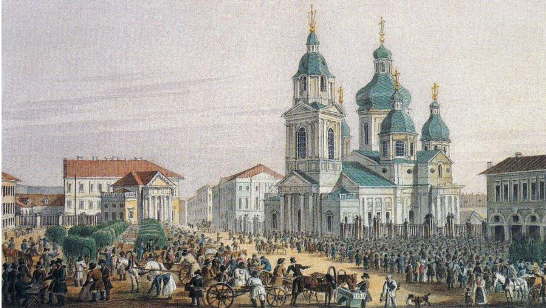
Сенная площадь. Успенский Храм. Разрушен после революции...