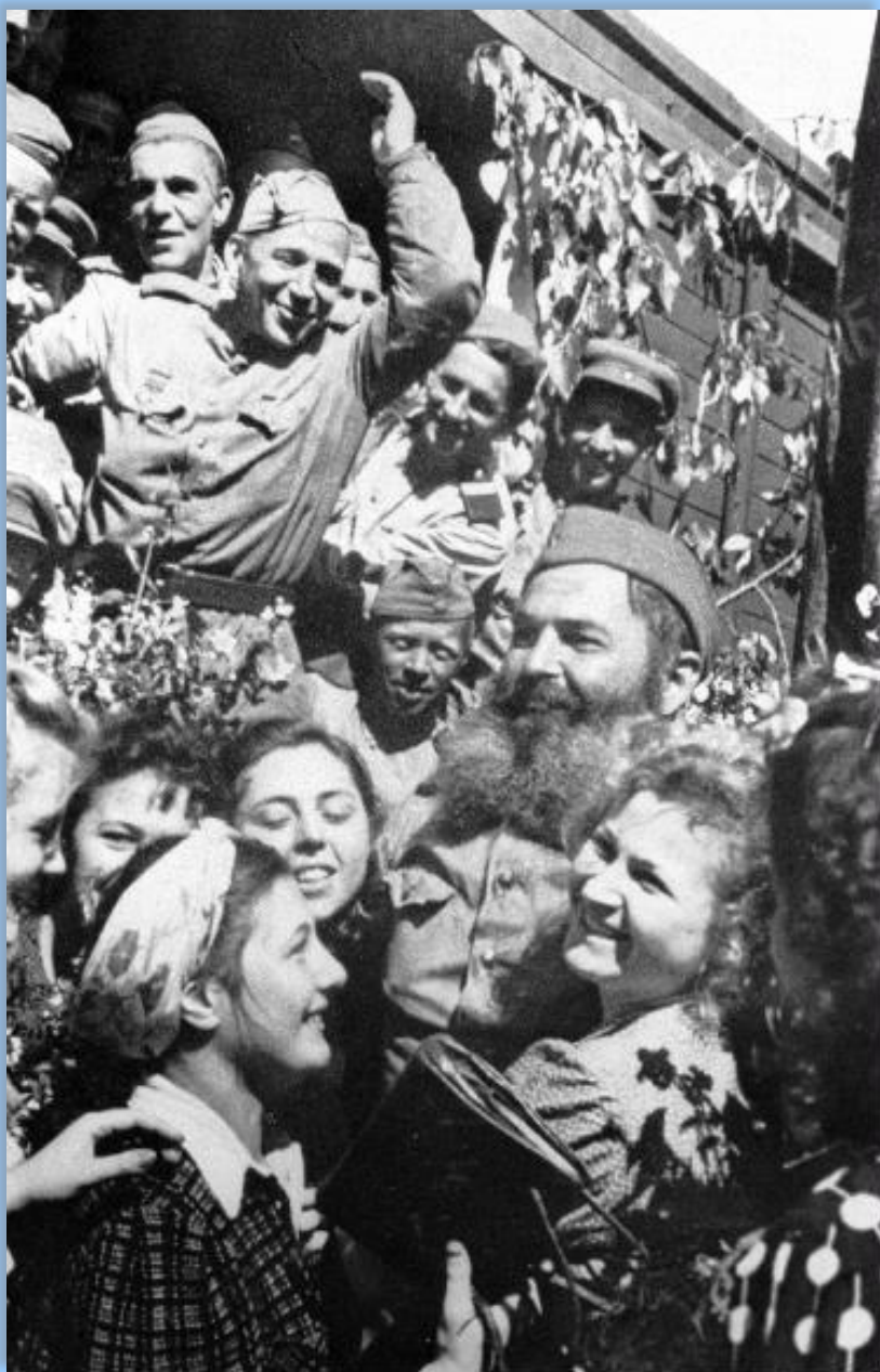
Москва, Белорусский вокзал. Май 1945 года. Встреча советских воинов-победителей.