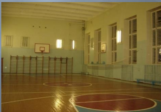
Большой спортивный зал