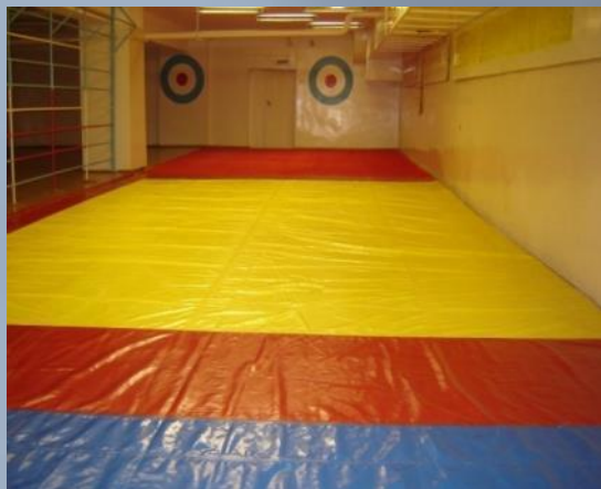
Малый спортивный зал