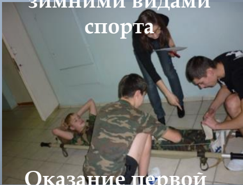
Оказание первой медицинской помощи