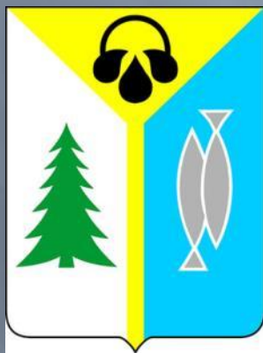
Герб г. Нижневартовска