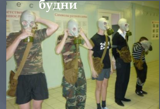
День гражданской обороны