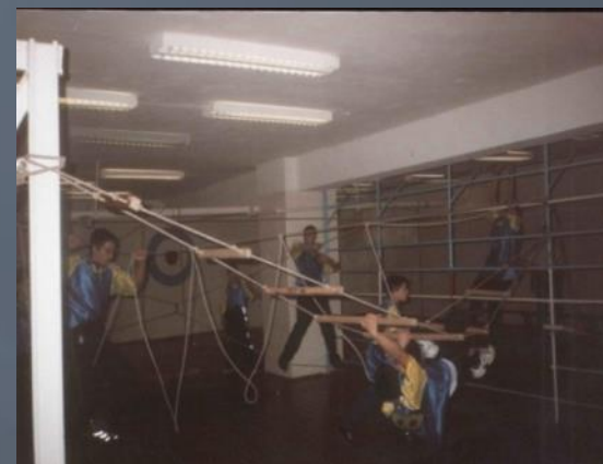
Зал для занятий туризмом