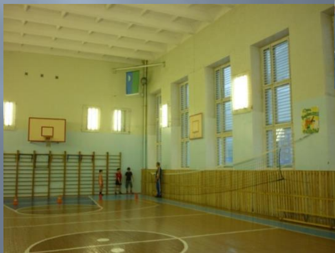
Торжественное поднятие флага