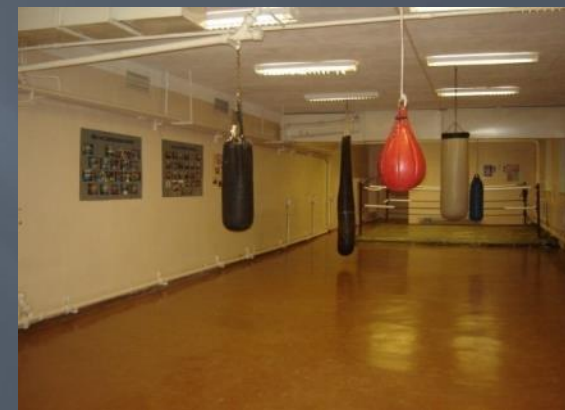
Зал для занятий АРБ армейским рукопашным боем