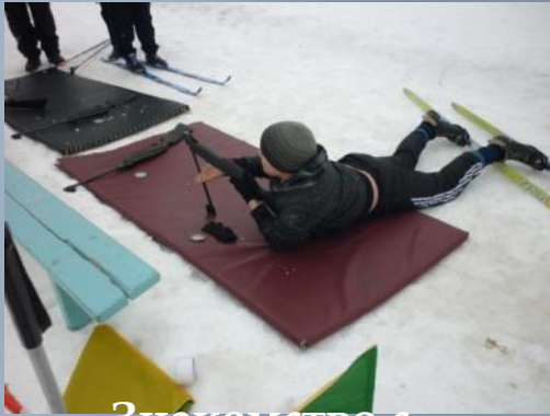
Знакомство с зимними видами спорта