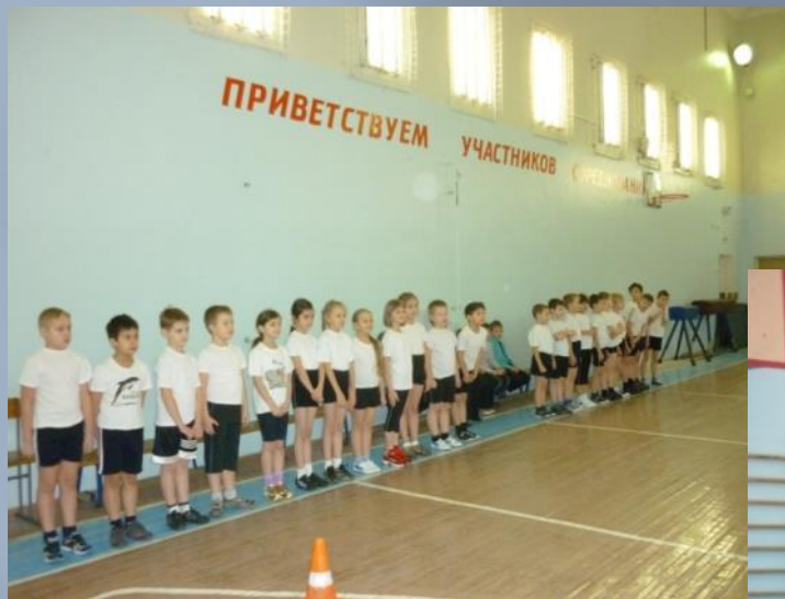
Построение 1-4 классов