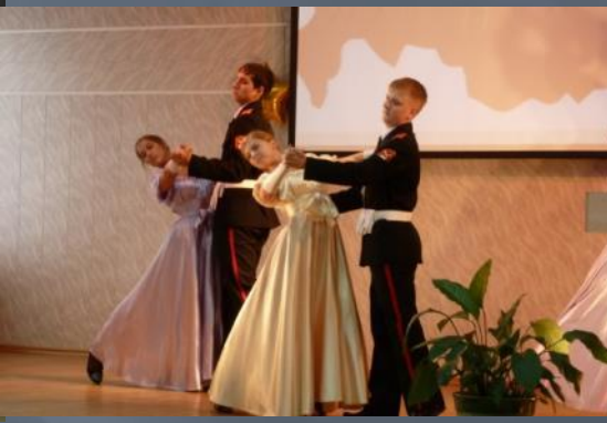
Творческий номер от 11А класса