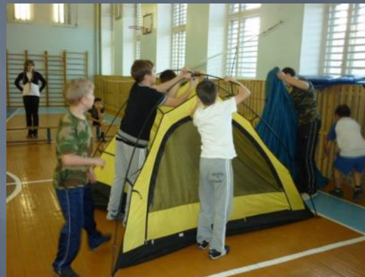
Элементы туризма на уроках