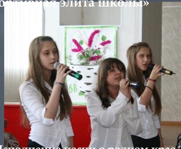
Исполнение песни о родном крае