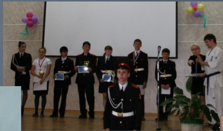
Награждение грамотами школы «Спортивная элита школы»