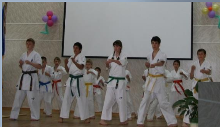
Выступление секции каратэ