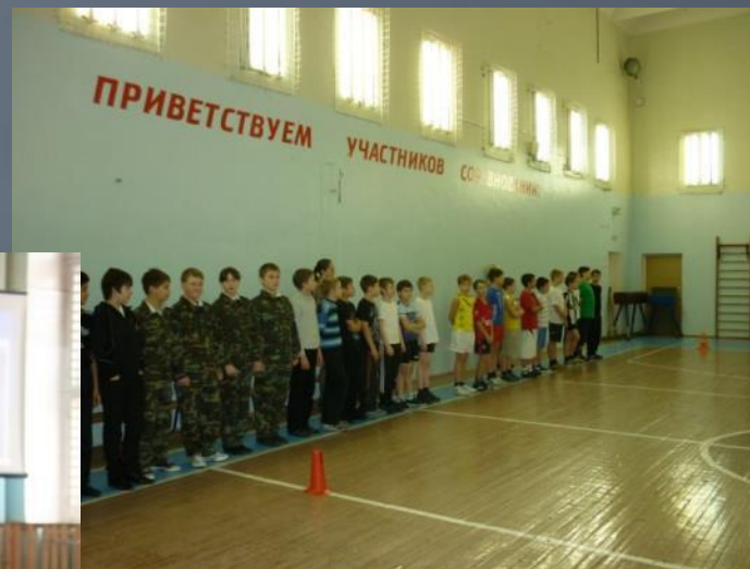
Построение 5-8 классов