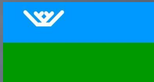
Флаг ХМАО - Югра