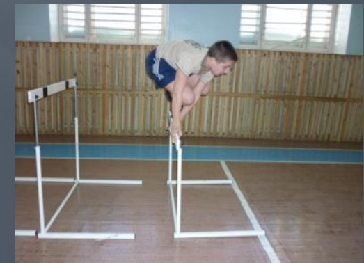
Нам нужна только победа!