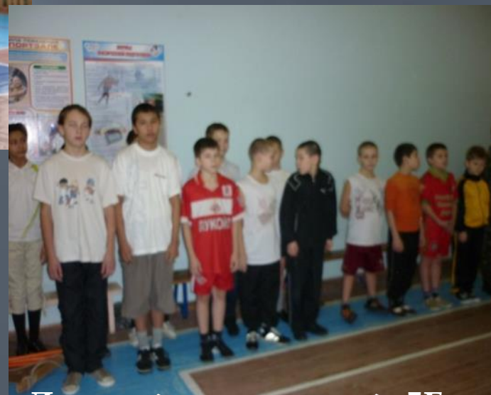
«Лучший спортивный» 5Б класс