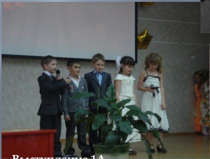
Выступление 1А класса