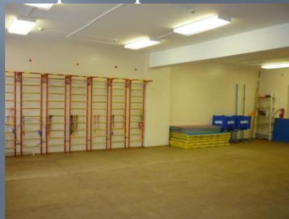
Зал корригирующей гимнастики