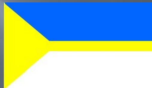
Флаг г. Нижневартовска