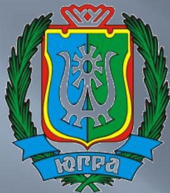
Герб ХМАО - Югра