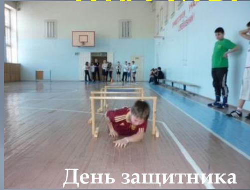
День защитника Отечества