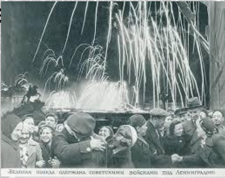
«Великая победа наших советских войсках под Ленинградом!»