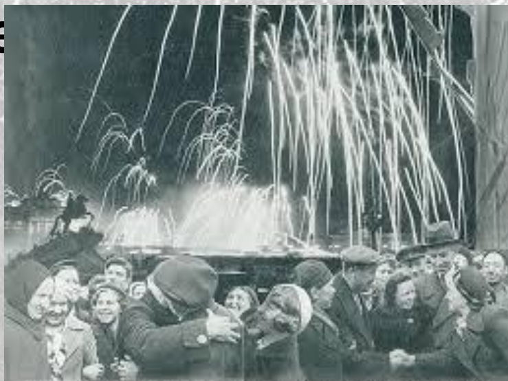
«Великая победа наших советских войскаев под Ленинградом!»