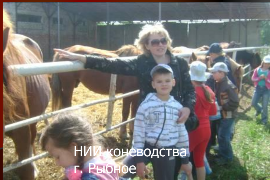
НИИ коневодства г. Рыбное