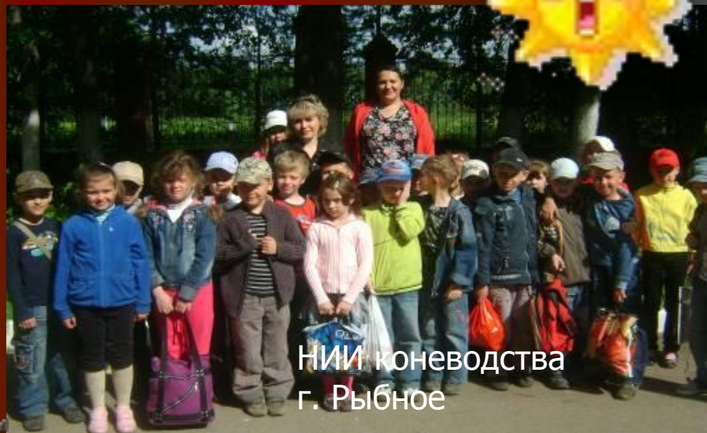
НИИ коневодства г. Рыбное