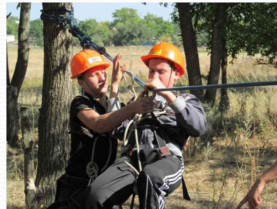
День цивільної оборони