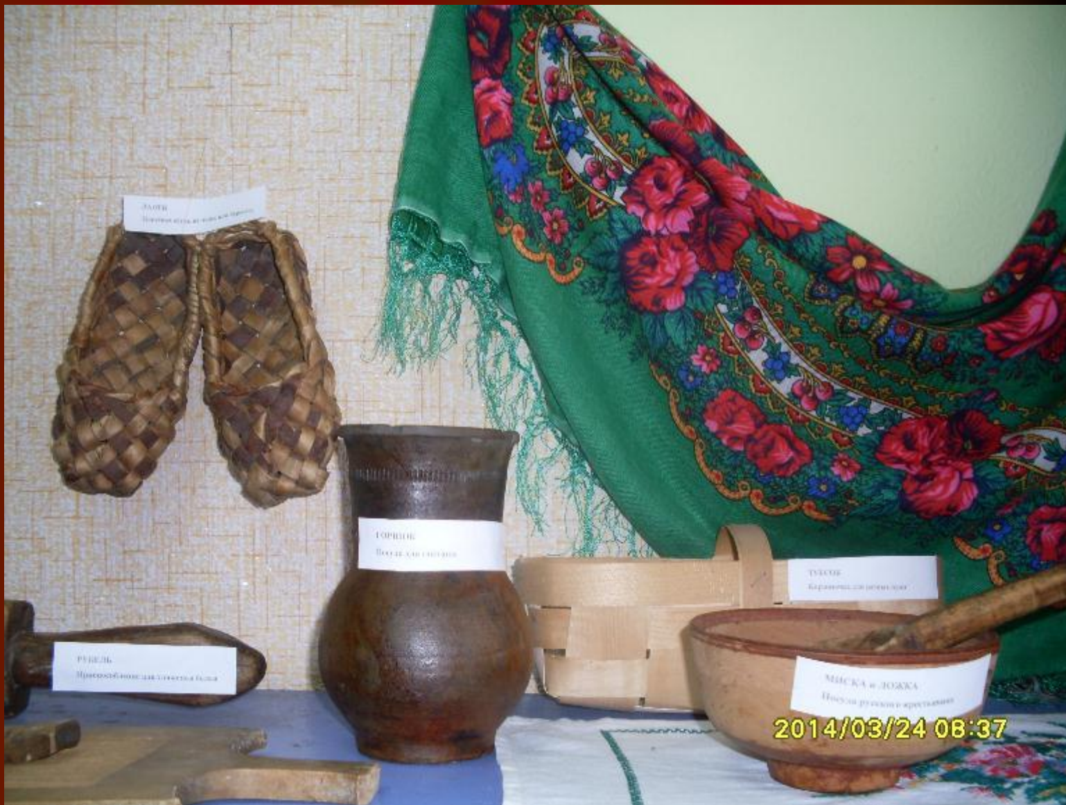
КОШИ Плетеные корзины из лозы или бересты