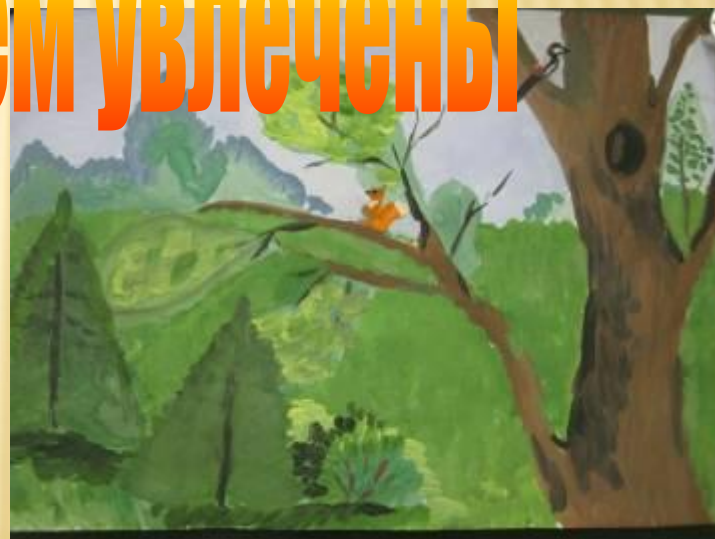
Работы участников школьной изостудии