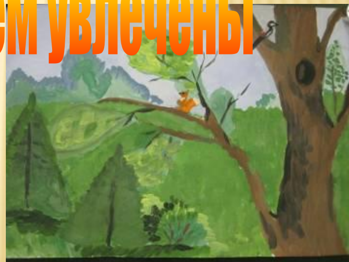
Работы участников школьной изостудии