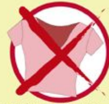
No Baby Tee / Midriffs