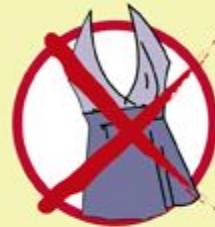
Low-cut Blouses / T Shirts