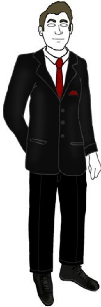
Business / Informal