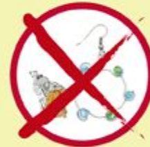
Earrings / Face Accessories