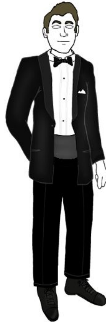
Black Tie / Semi-Formal