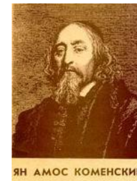
ЯН АМОС КОМЕНСКИЙ