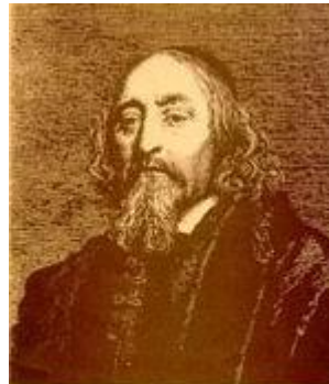
ЯН АМОС КОМЕНСКИЙ

Поставлена проблема нравственного и гражданского воспитания человека нового времени