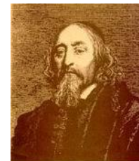
ЯН АМОС КОМЕНСКИЙ

В России эти ценности были восприняты во 2-ой половине XIX века, когда широко отмечалось 300- летие со дня рождения Коменского