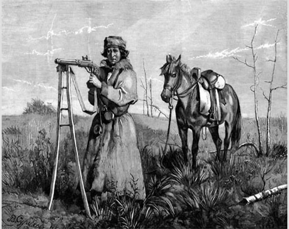
Минусинский татарин на охоте

В тайге они добывали лисицу, колонка, горностая, белку, зайца. Охотились также на волков, лосей, косуль, рысей и медведей. Летом добывали кротов. Обилие дичи способствовало сохранению охоты на диких гусей, уток, куропаток, рябчиков, глухарей.