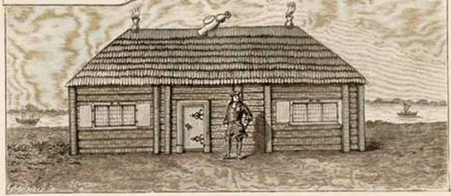
ДОМИКЪ ПЕТРА ВЕЛИКАГО